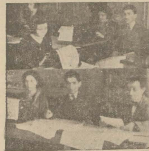
Vilâyette sayı- lav seçimi için çalışılıyor

Istanbul Kadınlar Birliği dün saat on altıda, Birlik merkezinde bir to- planti yapmıştır. Ayrıca, İstanbulun en eski kız mektebi olan İstanbul Kız lisesinde de merasim yapılmıştır. Türk