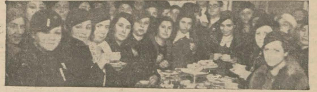
Türk kadınları Kadınlar Birliğinin dünkü toplantısında

müteahhide işlerin çabuk bitirilmesi i- çin tebligat yapılmıştır.