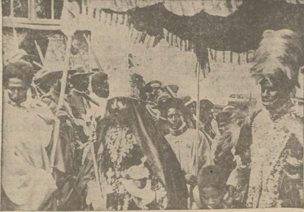
Habeş hükümdarı ve maiyeti

Stefani ajansı ise mitralyozlu, toplu bin Habeşli efradın İtalyanlara saldırdığını bildiriyor. İngilizlerin teşebbüsü