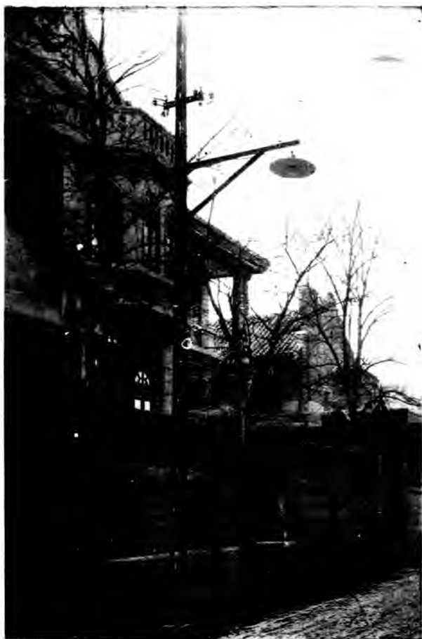
東亞協進會會址 天津日界宮島街三番四號 電話二局三六一號