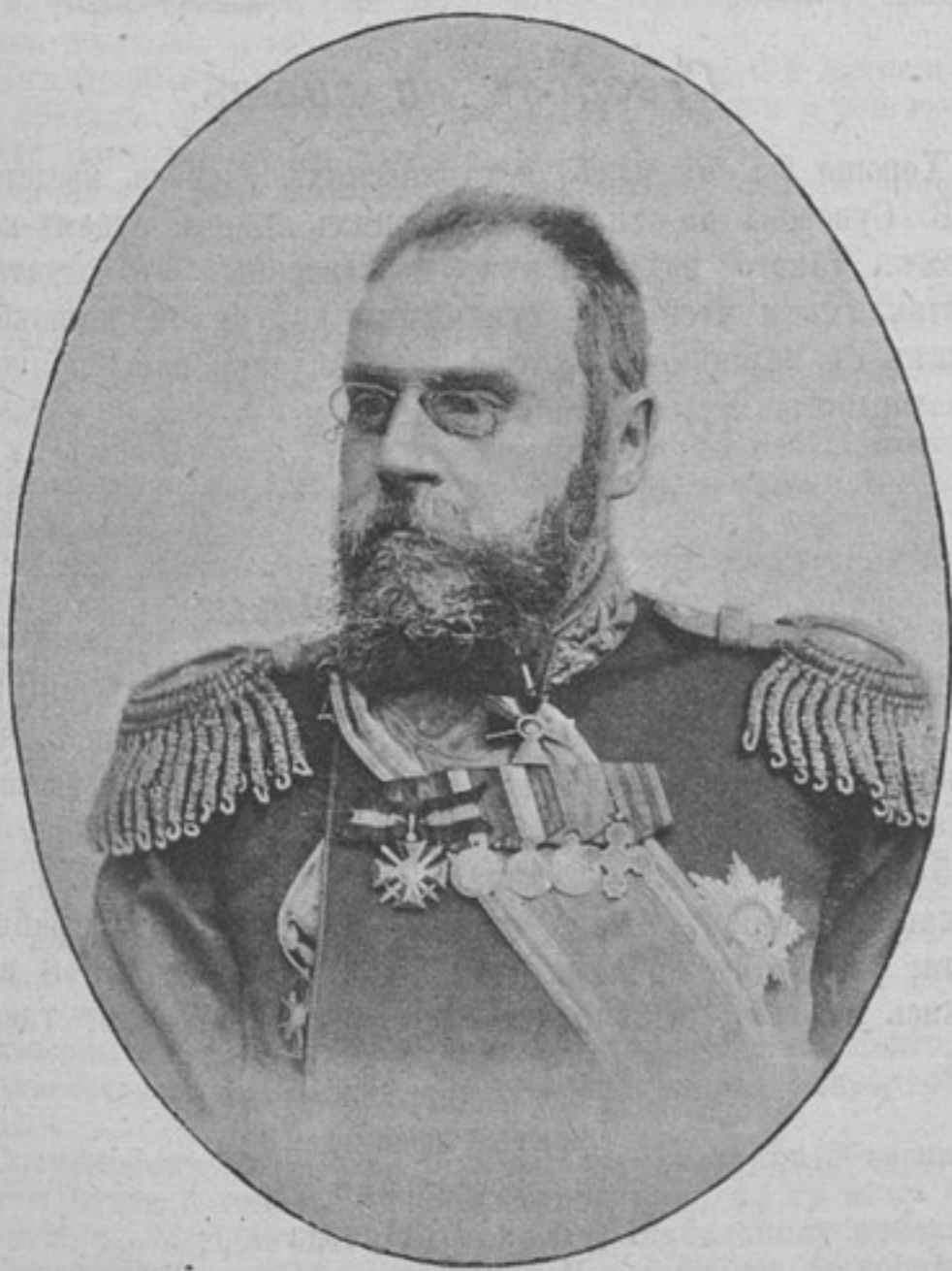
Начальникъ 18-й пѣхотной дивизіи, генераль-лейтенантъ

Цѣна XIV-й книги 1 руб. , а съ пересылкой 1 руб. 20 коп.