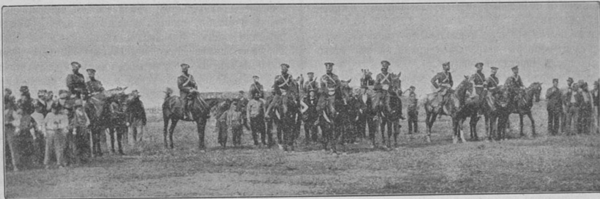
Князь Фердинандъ. Полковникъ Епанчинъ. Смотръ 5-го коннаго полка Болгарской арміи.

Общее впечатлѣніе, вынесенное отъ ученья 5-го коннаго полка, было прекрасное; ученье было произведено въ большомъ порядкѣ и стройно, а атака — лихо; лошади мѣстной