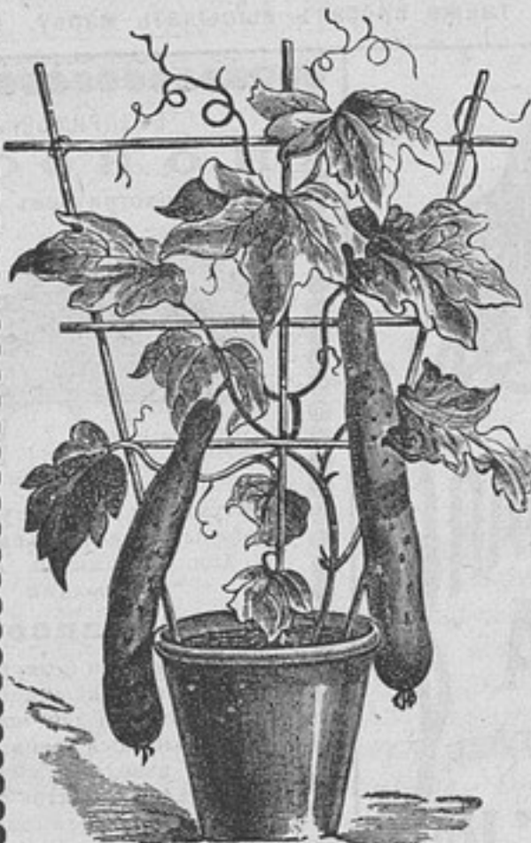
Комнатный огурецъ М. В. Рытова.

Для посѣва въ январѣ высылаются наложеннымъ платежомъ (цѣны указаны безъ пересылки):