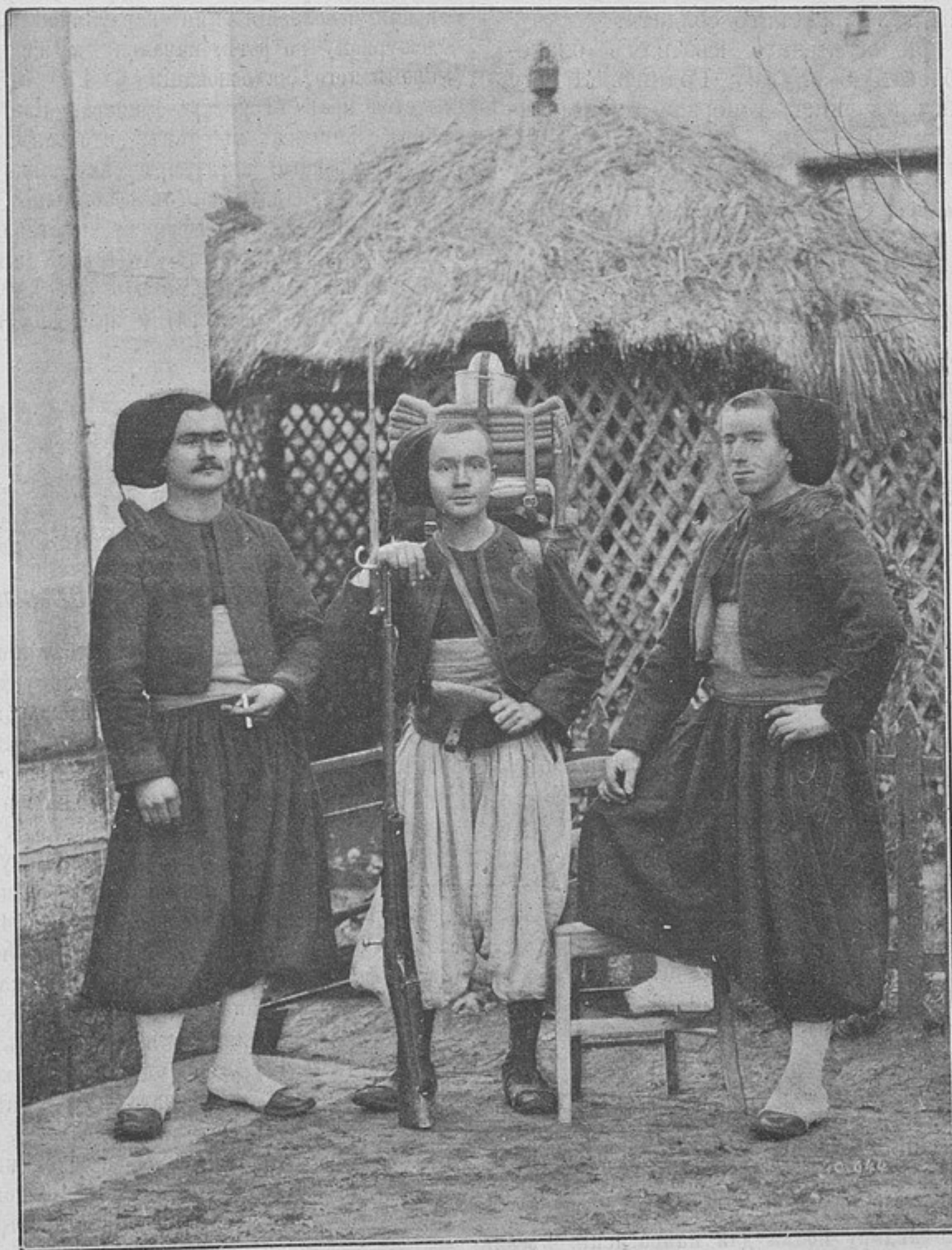
Тюркосы или Алжирскіе стрѣлки (Франція).

Экземпляры сданы почтамту одновременно для подписчиковъ, внесшихъ годовую плату полностью при самой подпискѣ, а потому не получившіе означеннаго приложенія благоволятъ немедля сообщить объ этомъ въ редакцію, для заявленія почтамту.