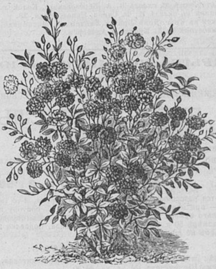
Японская лилипутовая ремонтантная роза.

Сѣмена Муза Элизете (банана). Великолѣпное орнаментальное растеніе для убранства газоновъ и большихъ группъ. При хорошемъ уходѣ достигаетъ къ лѣту 2—3 арш. выш. За 10 зер. 35 коп., за 5 зер. 20 к.