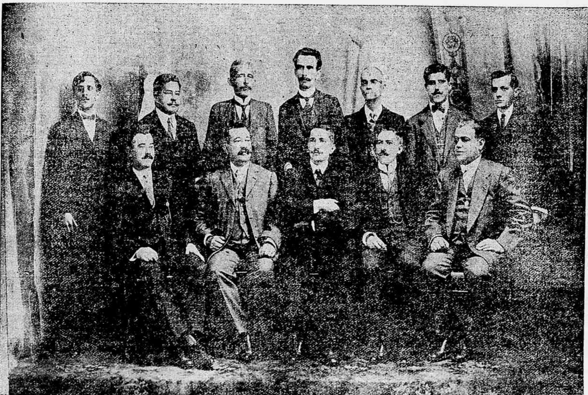
Os funcionarios da agencia das cooperativas agrícolas