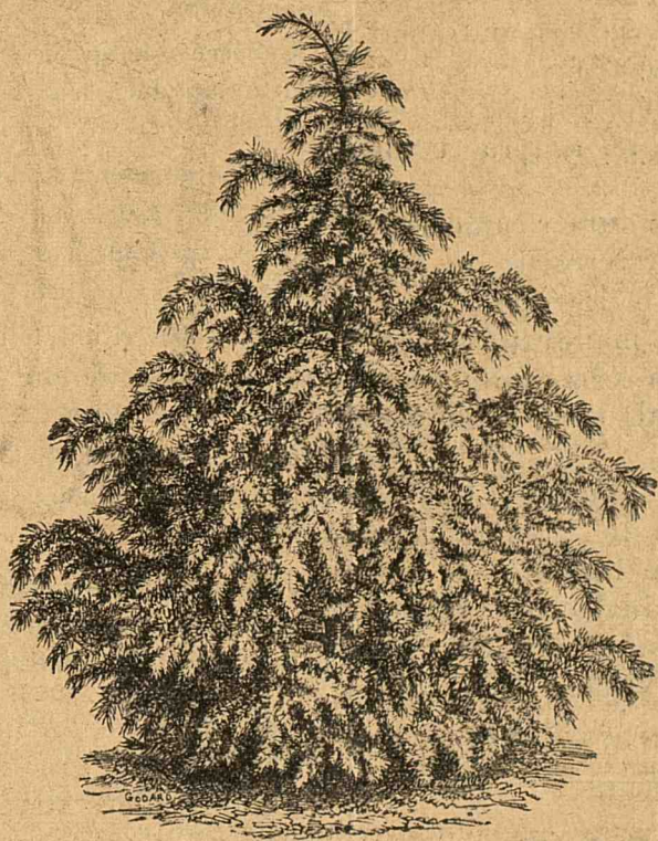
Cedrul Deodora, (a se vedea articolul relativ din acest No.

Dar, dacă Cedrul de Liban a pierit în patria sa, civilizația ne-'l păstrésă; și ași există Cedri în multe părți, plantați prin parcuri pentru forma piramidală a copacului, pentru culoarea verde închisă a frunzelor și