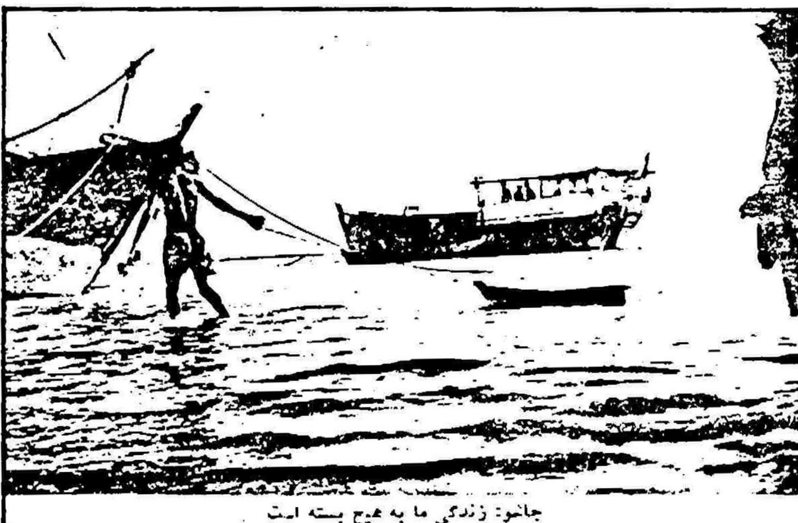
جاشو: زندگی ما به هیچ بنده است

«قبلا تو بخرین هر ۱۰۰ تومان ۵۵ روسم می ارزید. الان هر ۱۰۰ تومان معادل ۲۵ روسمده و واقعا برای ما مشکل و زحرد شده است.» خاستی دیگری میگوید: «آزادی آقا، آزادی که بانه، حدی حدی است. الان ما خدا را شکر می کنیم که بر بدست آمریکاسیم تابع دولت خودمون هستیم. اگر کسی هم بکشم اشکال نداره، چون دیگه مملکت مال خودمون.» از آنها خدای تویم. لحدنه ای میرسانند در رفمان می کنند.