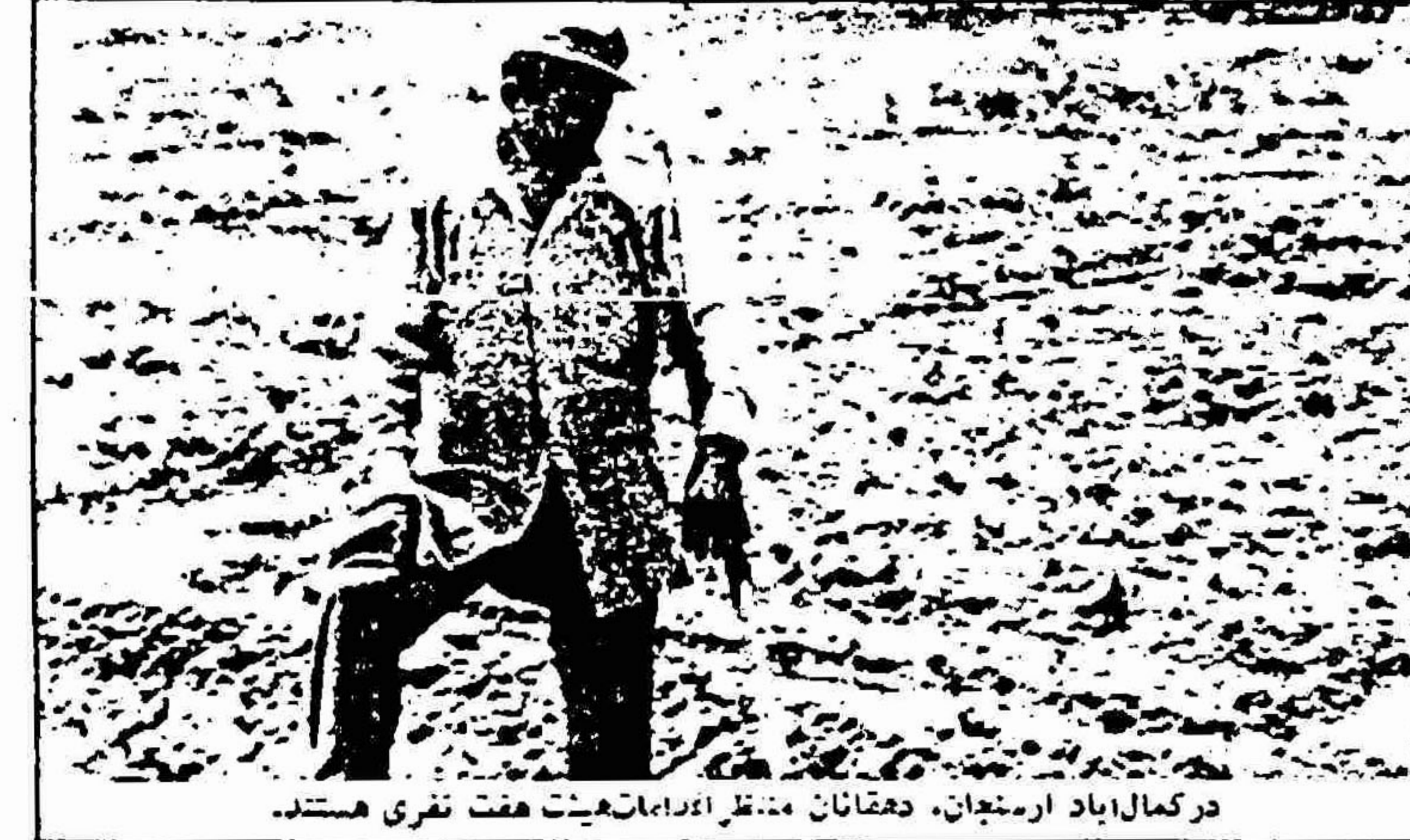
در کمال‌آباد ارسحان، دهقانان منتظر اقدامات هیئت هفت نفری هستند.

امسال گرانی وسایل درو، نظیر کماسن، کشاورزان را ناراحت کرده است. صاحبان کماسن امسال، بدون رعایت هرگونه ضابطه و قانونی، هر مقدار کزابه که خواسته‌اند، تمسک کرده‌اند. دهقانان نیز برای ازیس‌نرفتن محصول به اجار آسرا پرداخته‌اند. مسئول کشاورزی باید دست اس