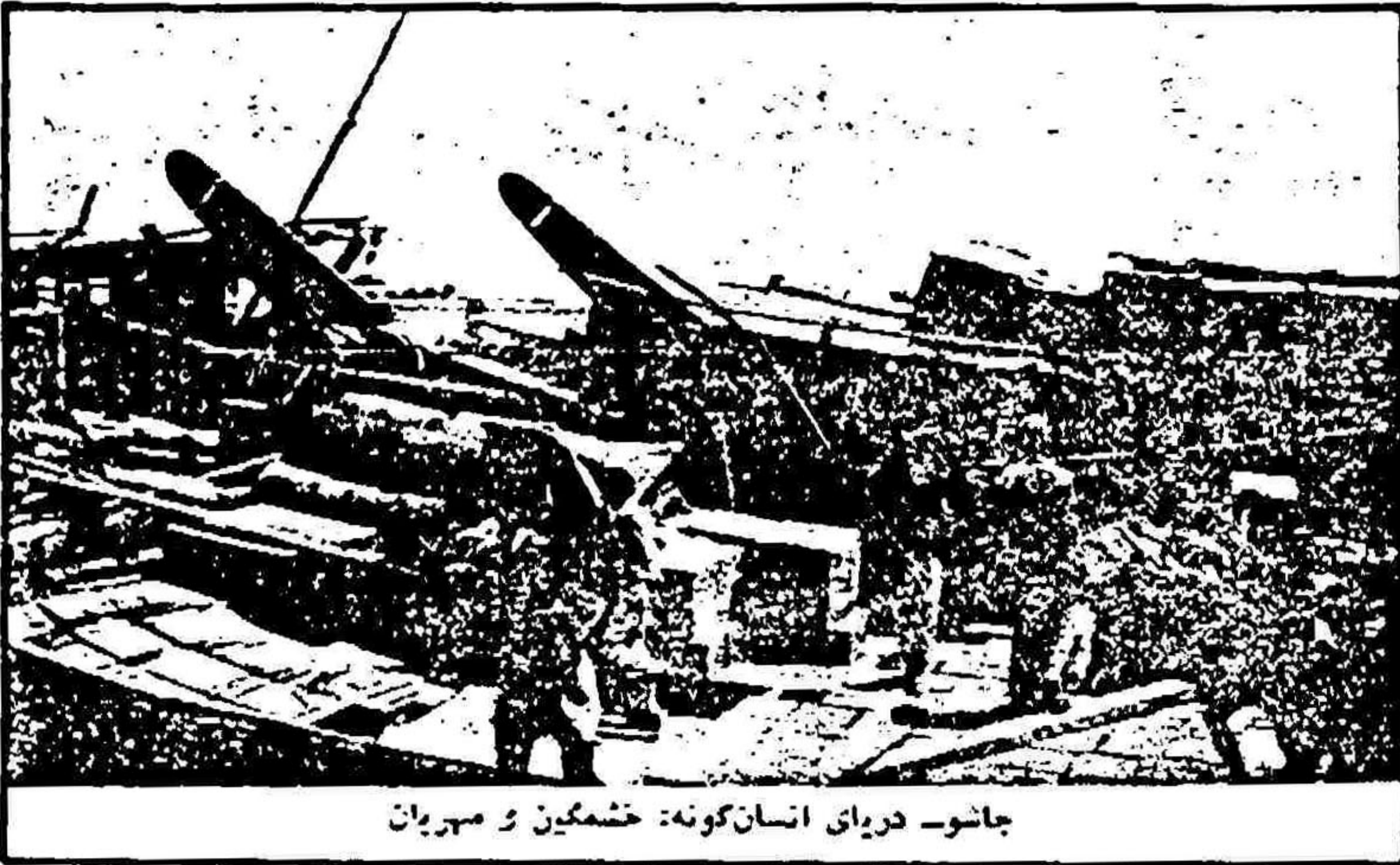
جاشو- دریای انسان گونه: خشمگین و مهربان

بر میبازد و نصف دیگر را به خانوها میدهد. ناس خودشان تقسیم کنند. مقدار بول هم سگی ناس دارد که تعداد خانوها چندمتر باشد. در بعضی کشتی ها ۶، ۷، ۸ و ۱۲ و بعضی ۱۴ و ۱۶ مرغسند و این هم ارتباطاً طریقت با کشتی دارد. وقتی کمی بیشتر آجما میدم، دیدم که جاشوهای سنتی دور و برمان جمع شده اند و هر یک درد دلی دارند: