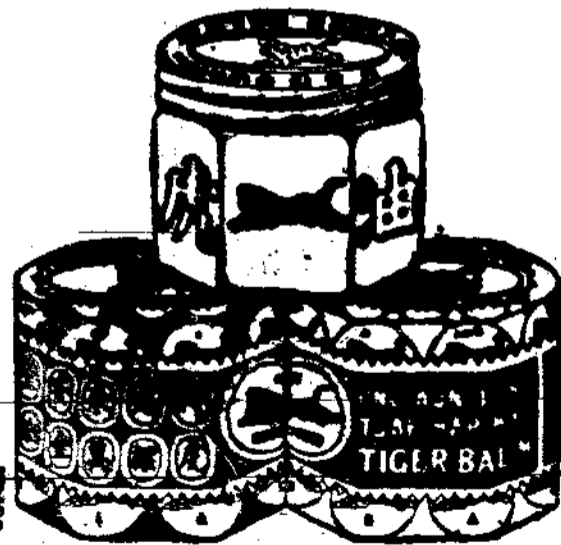
(印承司公樹印代時城吧)

虎標鮮艷人人識 品質精良世無敵 頭痛最好頭痛粉 靈藥有益而無損 心煩合用八卦丹 事務雖多也了閑 使閉且服清快水 清熱解毒功之魁 或服或擦萬金油 萬病霎時化烏有 記取仰光永安堂 藥賣全球姓名揚