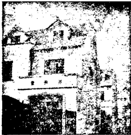
本公司新益一邨外景

該邨位於福履理路台拉斯脫路最近落成地點通中二十二路公共汽車可以直達四週均為高等住宅環境優美不羨塵夏 各宅均為假三層雙開間式底層客室書房均合理想二樓臥室二間分配均勻三樓因東南臨空光線亦極充足可以遠眺高閣亦可用作正屋 各宅間維持寬闊地位陽光充沛空氣流通屋宇高爽佈置雅潔為標準之新穎住宅