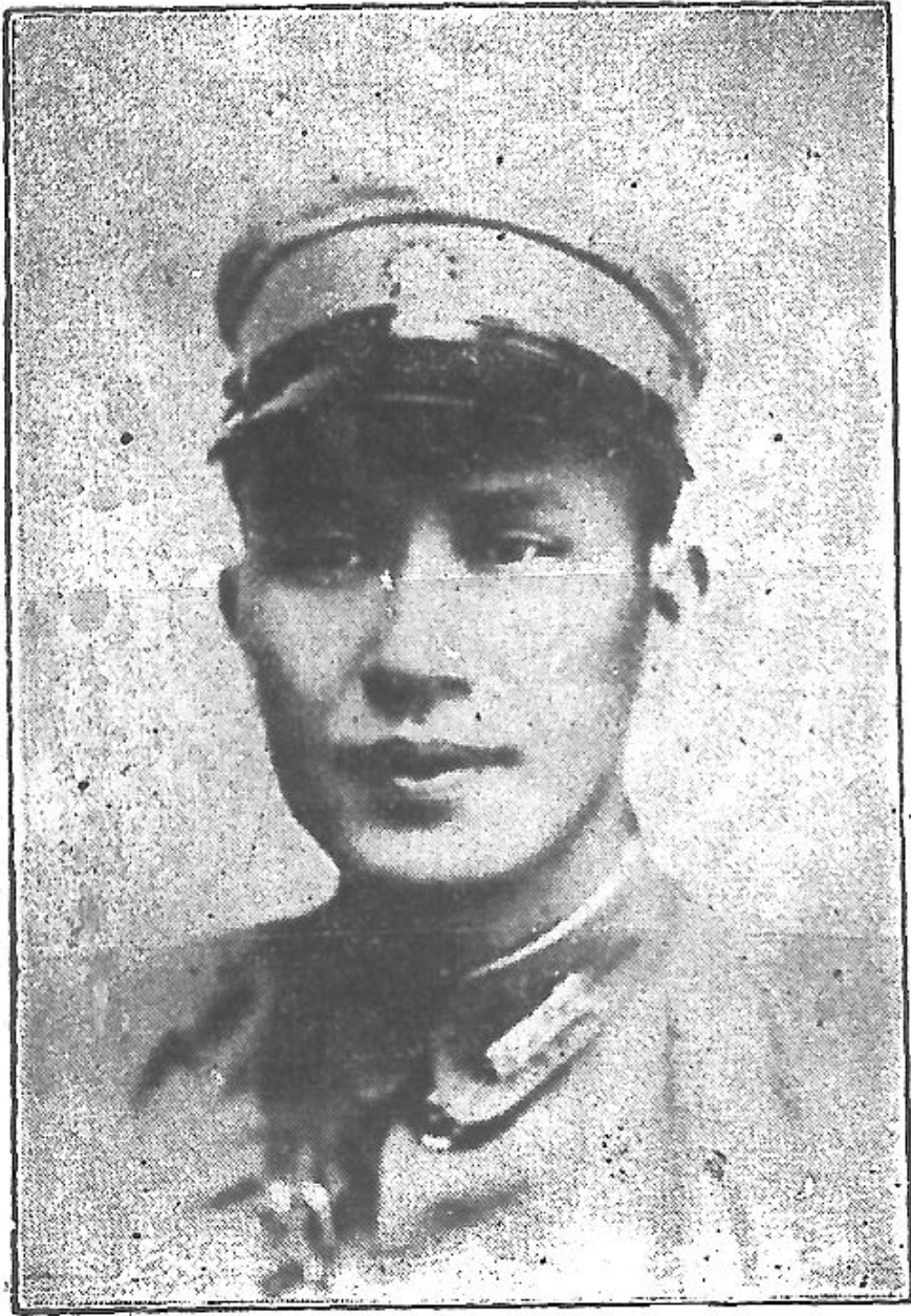
白副總司令嶺嶺肖像