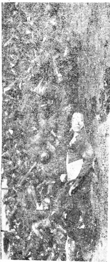
馬占山將軍率領大砍刀隊 在江上起得稱豪 破日軍大場 頭動天影 顛地戰血 五萬鬼片 餘萬鬼片

憂爲喜，轉危爲安，心中稍定，遂立時命令各路工兵，按着如此如此之鬼計，開始向中國軍隊陣營內燃放矣（讀者諸公現在對如此如此之鬼計，因爲著書人未揭破陰謀，一定很着急想看看早些明白究竟如此如此是什麼罷，）如此如此鬼計，就是放黃色漫漶性（最烈）的毒瓦斯彈，合窒息瓦斯彈，且這些毒軍隊都備有防毒器具，可以博免，我們抗日軍隊聞見窒息毒斯