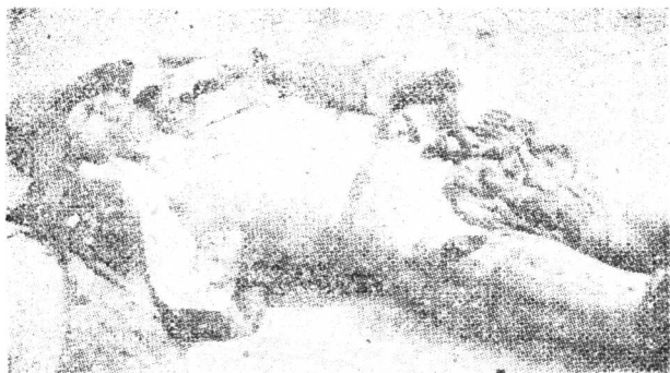
上將軍張作霖被炸地獄時慘案像 (一九二八年六月四日在皇姑屯車站發生)

日本裕仁昭和天皇，自准前內閣首相田中義一陸軍大將，奏請積極侵犯中國領土，並備吞併世界各國之秘密大陸政策，想坐世界政府之皇帝夢，野心澎湃已極，積謀廣慮，善劃深遠，無孔不入無隙亦乘，對中國時施挑撥，不眠不休，於一九三一年，即中華民國二十年日本昭和六年四月間曠使鮮人李昇重在長春縣第三區「萬寶山」地方，恃日武裝警察二十餘名，強行挖掘水道阻礙，當地農民通河流，並慘殺中國農民，因萬寶山慘案，日本政府並令行各地鮮民仇殺華僑，一九三一年七月間，朝鮮內各地華僑被鮮人慘殺致死者一百四十二人，受傷者五百四十六人，失蹤者九十一人，財產損失日幣四六三〇〇三元，係根據中國駐日公使奉外交部令，前往朝鮮調查之報告，（詳載劉震中著萬寶山慘案錄）茲將朝鮮華僑被鮮人慘殺之統計如下，鮮人舉動地方，日