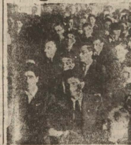
Yeşilay gençlerinin toplantısı

Her yıl Yeşilay haftası yapılması teklif edildi (Yazısı 5 incede)