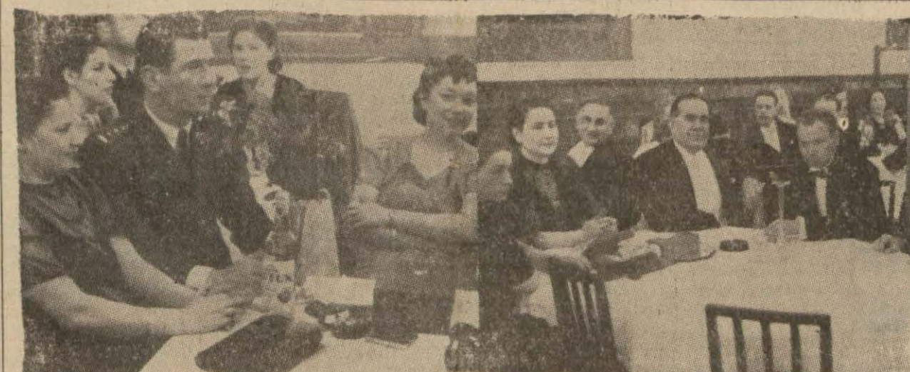
Başvekil Doktor Refik Saydamın himayesinde Hilâlahmer Beyoğlu kazası tarafından tertip edilen balo evvelki gece Tokatlıyan salonlarında verilmiştir. Baloda vali ve belediye reisi

Nevyork, 24 (A.A.) — Maruf tayyare yapıcısı Anthony Foker ölmüştür.