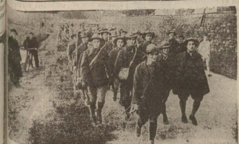
Galatasaraylı izcilerden mürekkep bir kâfile dün Büyükdereye kadar uzun bir yürüyüş yapmıştı. Resmîmiz yürüyüşe iştirak eden izcileri gösteriyor.

üzerinde yeniden keşif uçuşları yapmıştır. Paris, 24 (A.A.) — 24 kânunuevvel tebliği: Kaydedilecek hiçbirşey olma-