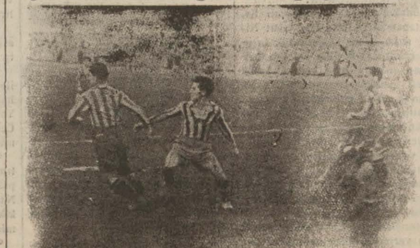
Dün oynanan Galatasaray — Fener maçından bir enstantane (Yazısı 4 üncü sahifede)