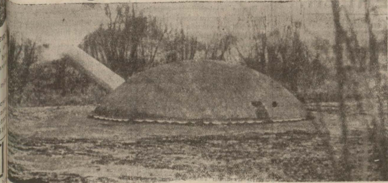
Majino hattından Alman hatlarına bir ateş!

Berlin, 24 (A.A.) — Alman askumandanlığının tebliği: Garp cephesinde gündüz sükûnetle geçmiştir. Alman hava kuvvetleri dün de Şimali Fransa