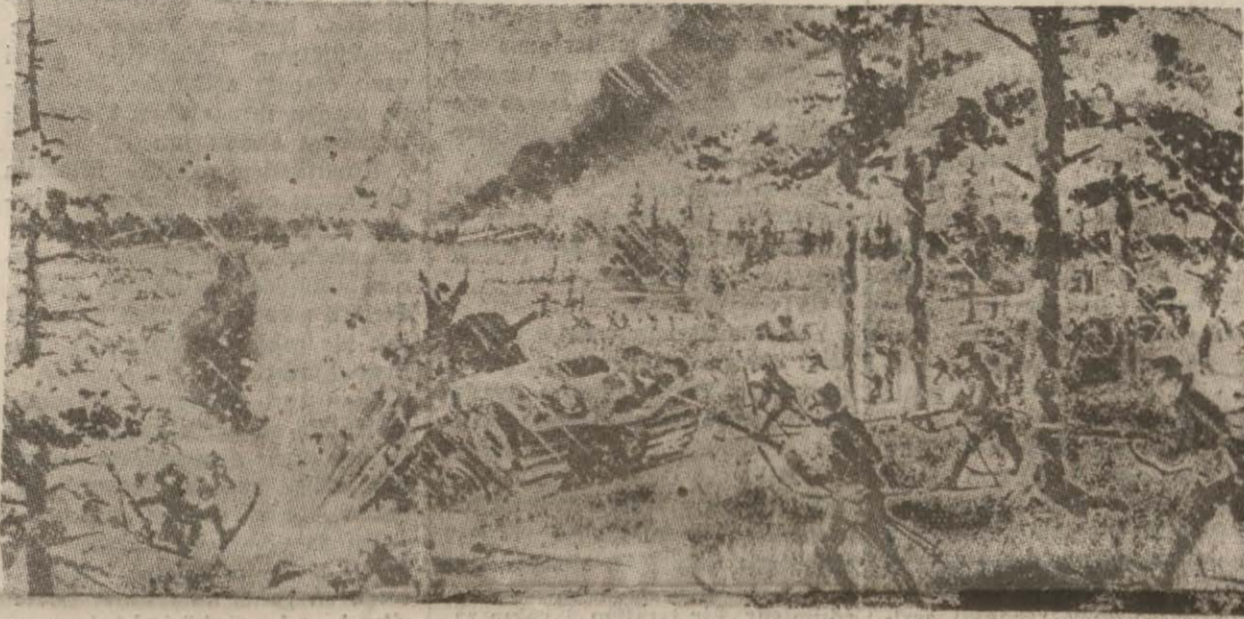
Sovyet. — Fin harbine ait temsilî bir resim

Helsinki, 24 (A.A.) — Şiddetli kar fırtınaları, Finlandiya'nın şimal steplerinden kar karışık bir halde ricat etmektedir. (Devamı 5 incede)