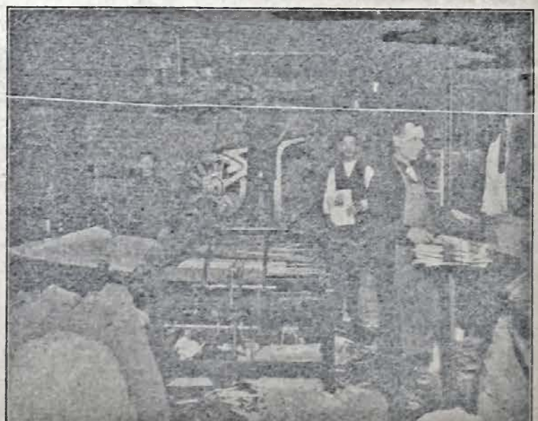
Галєя машин і експедиція „Свободи”.