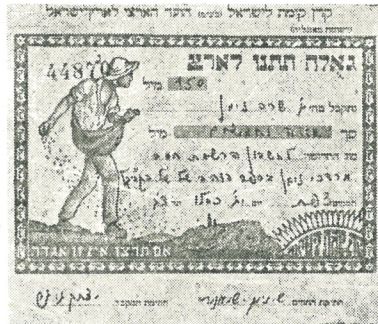
הקבלת של הקק"ל