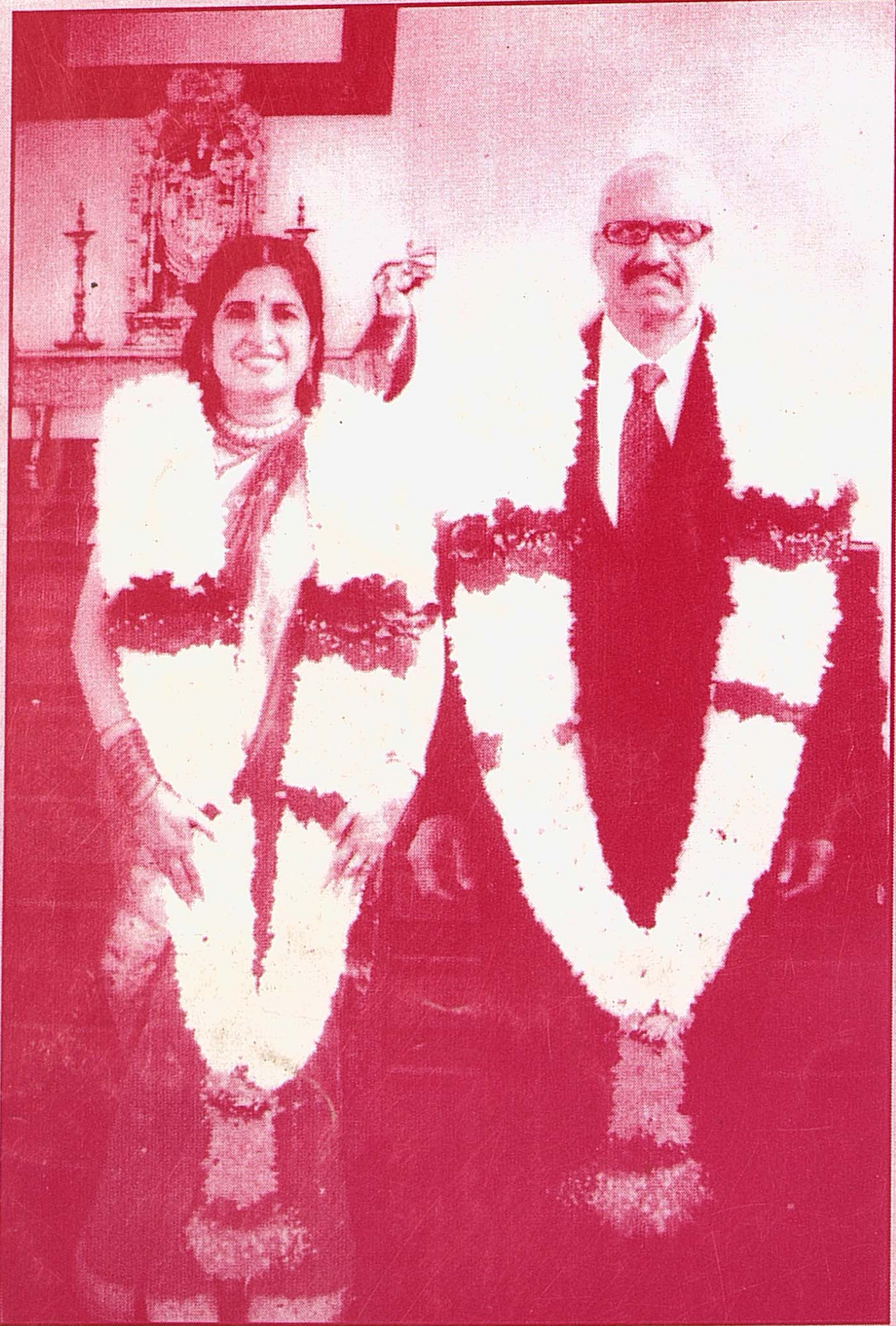
அரசு மாமணி மர். புரவியப்பர் இணையர்