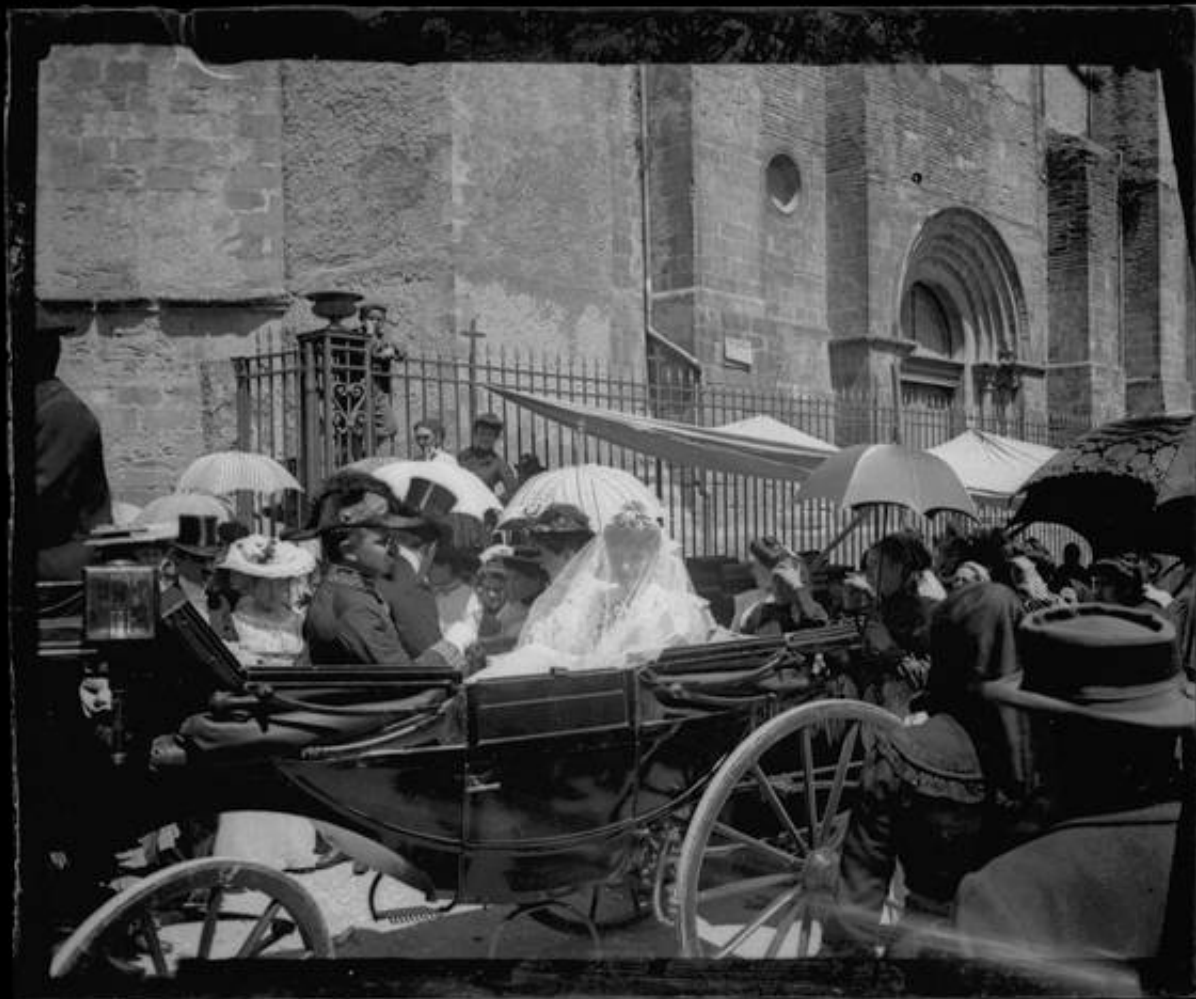
Mariage Troye, 1905