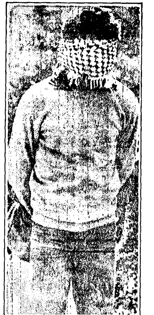
این عکس اندکی پیش از اجرای حکم از ابوصبح گرفته شده است.

خبرگزاری وفا در طی یادداشتی گفت نقش مصر دایر