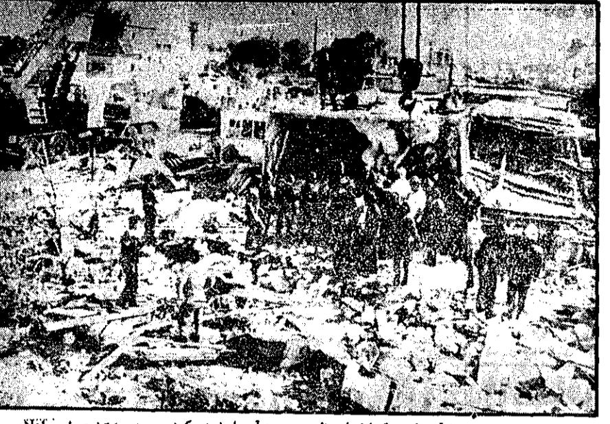
این پایمانده خانه‌های در تل آویو است که انفجار عظیمی دیروز آن را منهدم کرد و دوقدر را کشت. پلیس اعلام داشت که انفجار ممکن است ناشی از خروج گاز از لوله باشد، اما احتمال خرابکاری نیز مورد بررسی است و چند تن عرب ساکن پیرامون خانه برای بازجویی بازداشت شده‌اند.

بهرت، یکبارس- چریک‌های فلسطینی چهارشنبه مسئولیت یک انفجار را در حومه تل آویو به عهده گرفته و گفتند این حمله قسمتی از حملات بعدی چریک‌ها در داخل خاک اسرائیل است.