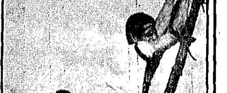
این چهارتن دربار یک شورای اجرائی عابترین سازمان حکومت انتقالی موافقت کردند.

نقش راهبره را در این ایرا، فلسباوتز، خواننده سویر انوی امریکایی بازی میکند که در برنامه‌های دیگری نیز چون «سالومه» برهنه شده است.