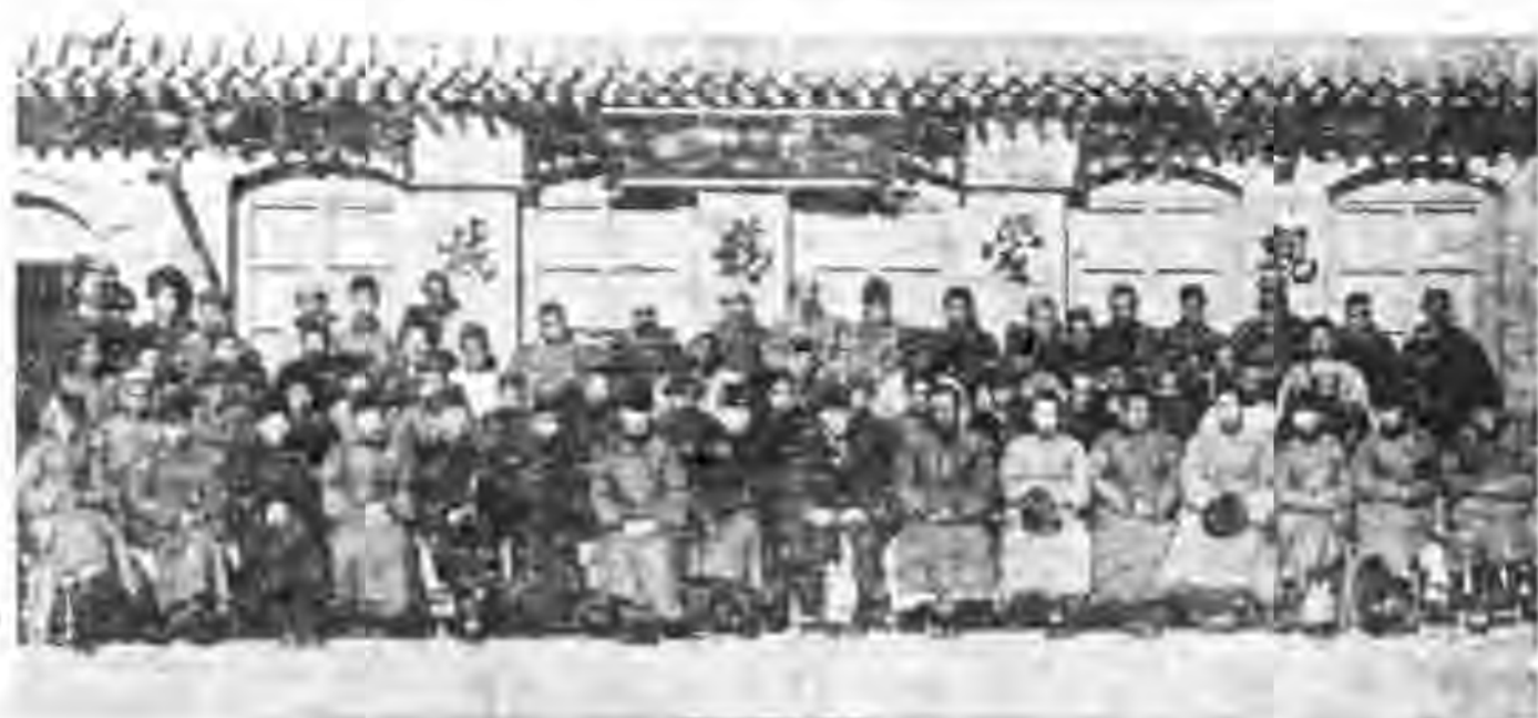
赤城合作社習會攝影