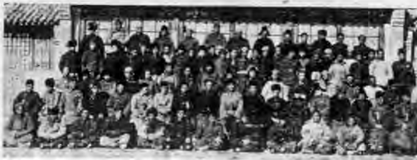
龍關合作傳習會攝影

八、第一條定名。不要忘了填。縣字上的空格。填本縣的縣名。縣字下的空格。填本村的村名。 九、第四條區域。不要太大。最好以一村為單位。可以寫本村字樣。如數村合組一社。須將各村村名填入。社址就是合作社辦事的地方。亦應詳細填明。如某街門牌某某號或某宅等。