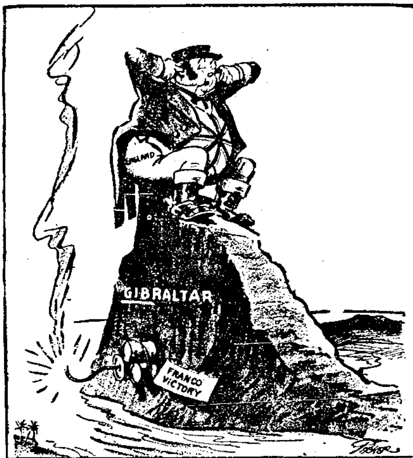
火山上的不大顯列