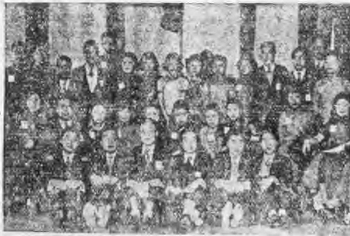
友聯社全體社員合照

以「西方文化的結晶」，——基督的犧牲與博愛的精神，為這般徘徊歧路的青年們服務，使他們自動的生出熱情，發出友