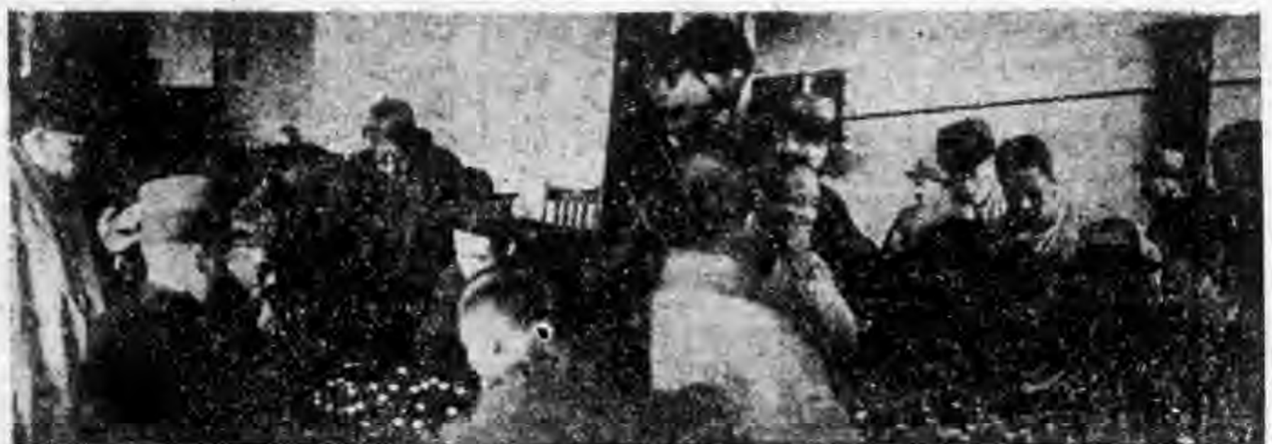
（攝文鴻） ■ 形情局對時賽預賽比棋象市全行舉會本 ■