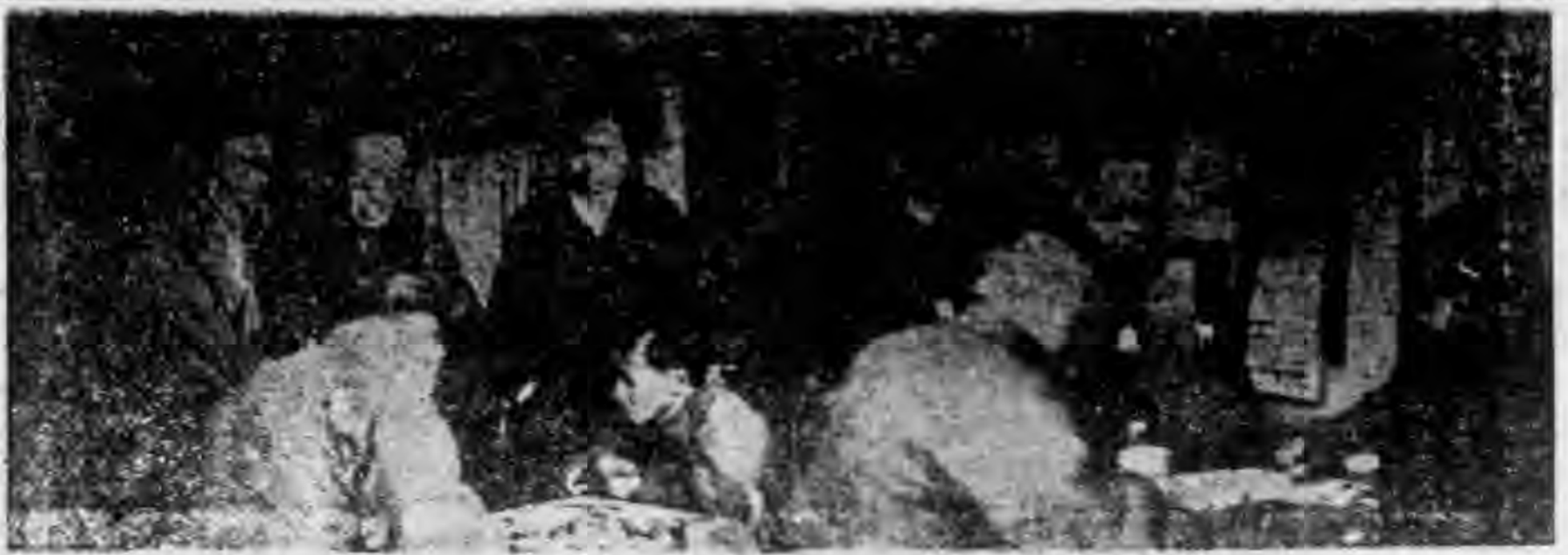
■ 真寫時奕對員社社究研棋園會本 ■