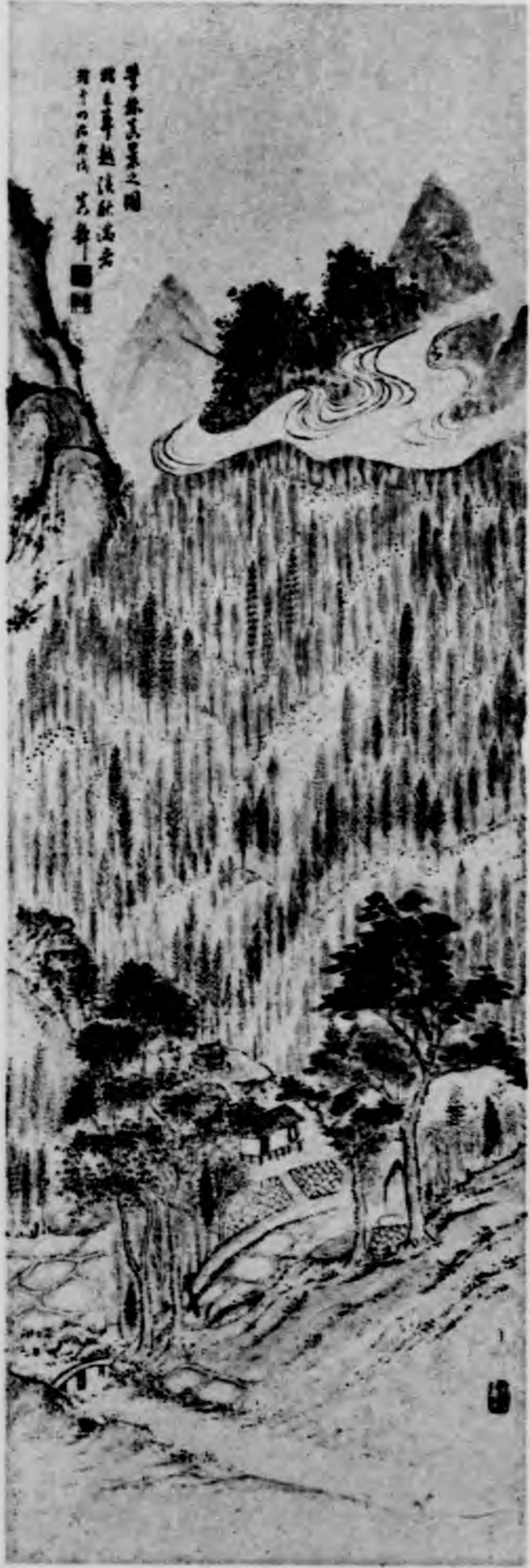
柏木眞靜氏畫學林眞景之圖