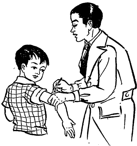
種過牛痘不會患天花