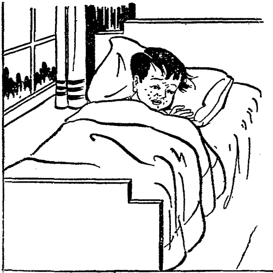
染着天花的人，先惡寒，後發高熱。

天花的起因，是由於痘瘡的病原小體，侵入人體。這種病原小體，非常微細，可以通過瓷坯的孔隙；小得