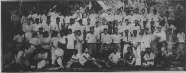
23年全體營員及領袖於籃球場攝影