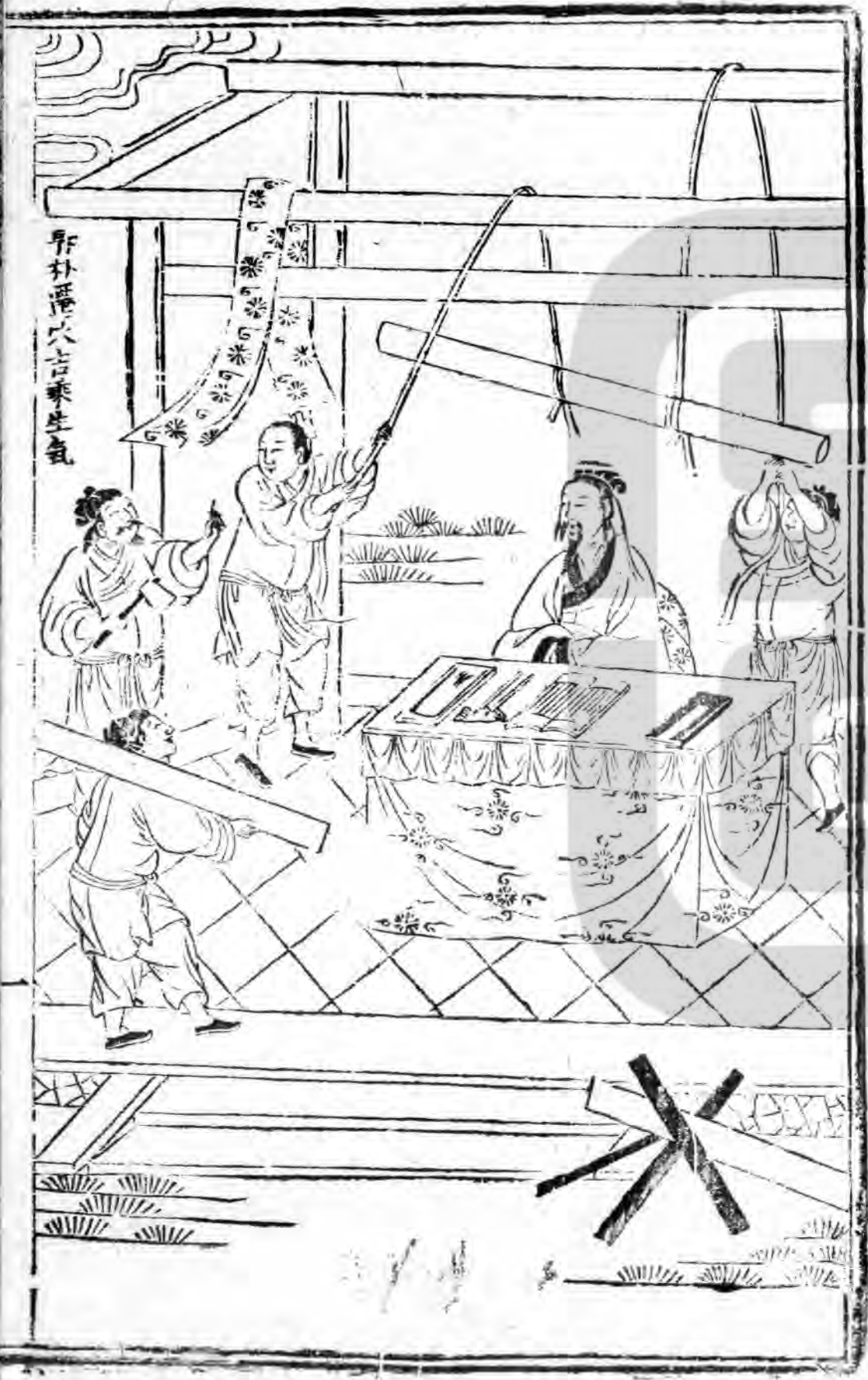
卦卦遷以吉乘生氣

雞占 ○牛奔入堂不久有災患 ○猪來至公事 ○鴨來至珍退 ○雞夜啼不寧 ○犬啼亦至不寧 ○牝鷄鳴至小口灾病生小邪人不安 ○犬上屋至 凶 ○鼠咬衣有是非 ○鼠作鴨鳴火盜喪亾 ○鳥屎墮衣巾至失財孝