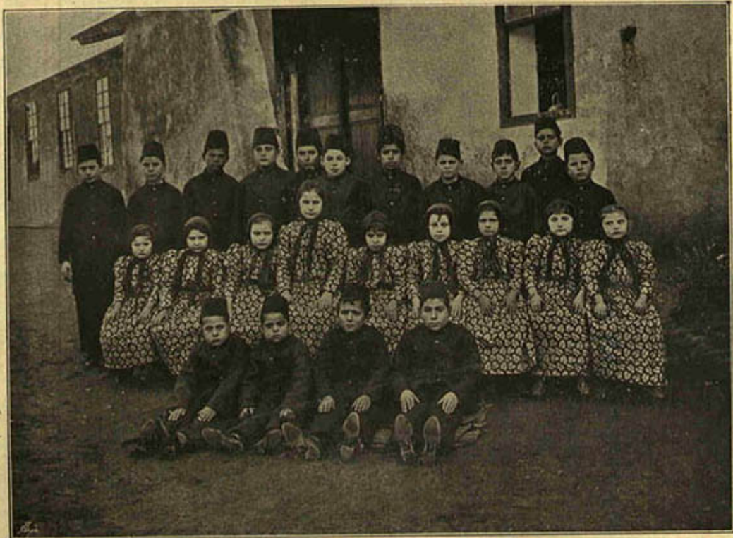
کرید مصائبزدکانی ایتمندن اولوب سایه مراحویه جناب پادشاهیده الباس اولنان چوجقلردن برقاچی

Les orphelins des victi mes crétois habillés par l'Etat.