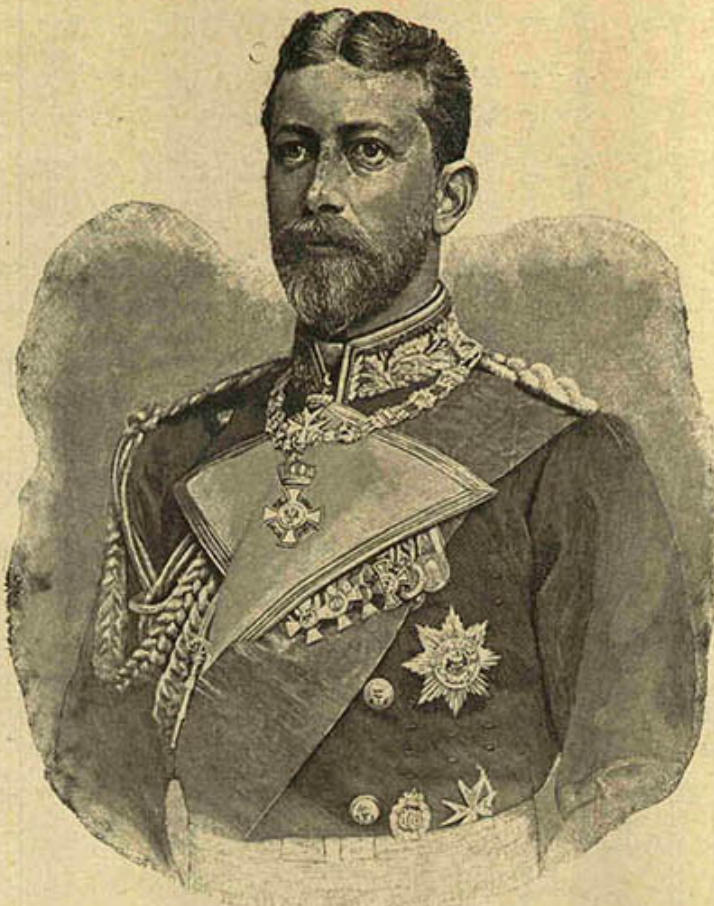
[ فیلو قوماندانلی ایله چینه عزیمت ایدن ، المانیا امپراطوری ] [ حضرتلرینک برادرلری ، پرنس هازی ]

برابریند رحمتلرک برکتلی اولدیغی زمانلرده بره بوز اون ، بوز یکرمی و برمتک درجه سنده در . بوراده آقارصولر بولنما سندن طولانی یاغم وورسز سنده لرده بنغازی سنجاغی قحط و غلا ایتلا ایدر . برقا اراضینک مزروع اونیان قسم اعظمی خدای بابت و بیکارجه مو ایشیک تقدیسنه کافل درلو درلوبانات ایله مالاملدر . بونلرک بعضی اوقدر لغایب الرایحه در که صباح سر سندنکنده اورادن کین بر یولجی کنسیدی بر چمنزار هشتیده ظن ایدر . برقاچوللر- نده آرتنه زین ، یاخود عادی قویولر حفر اولوب صولری زراعت ایشلر نده استعمال ایدیه چک اولسه بقله ، مصر پائیس کی نیجه محصولات الده ایدیه چکی محققدر . بنغازی سنجاغنده دوه ، صیغر ، قویون ، کچی و سار حیواناتک کثرتی ، مقدارجه قابل اولان باغچه و بوستانلر نده پیشین سبز لرک فوق العاده لذت و دسامتی شو اراضینک هر درلو نباتات و محصولات بتشدیرمکده هیچ بریدن انانغی قالمیه جفتی انبانه کافیدر . اسقا واروایی بالکنز آره صره یاغان یاغمور لره . مقرر اولان نارالرنده غایت ابتدائی و بیسیط اصول ایله بتشدیریلن قارپوزلر کرک لذت و کرک جسم نتیجه دجله کنسارنده بر دقت و مهارت مخصوصه ایله وجوده کتیریلن مشهور دیار بکر قارپوزینه رقابت ایدر .