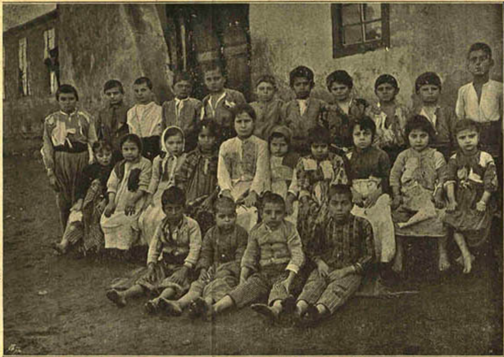
[ کربد مصائبزدگان ایتمنک قیافت سفیلاندلری ]