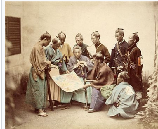
Самураји из области Сацума који су се борили на царској страни током Бошин рата.