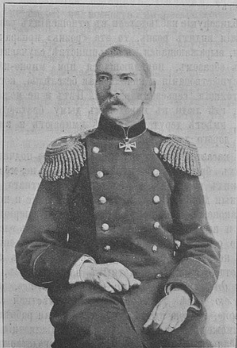
Членъ отъ Военнаго Министерства въ военно-окружномъ совѣтѣ Варшавскаго военнаго округа, генераль-лейтенантъ

Деньги могутъ быть высланы почтовыми марками каждая не дороже 50 к. Безденежная подписка не принимается. За перемѣну адреса 28 к. Отдѣльные №№ высылаются за 15 к. Объявленія принимаются по особой расцѣнкѣ, высланной по требованію.