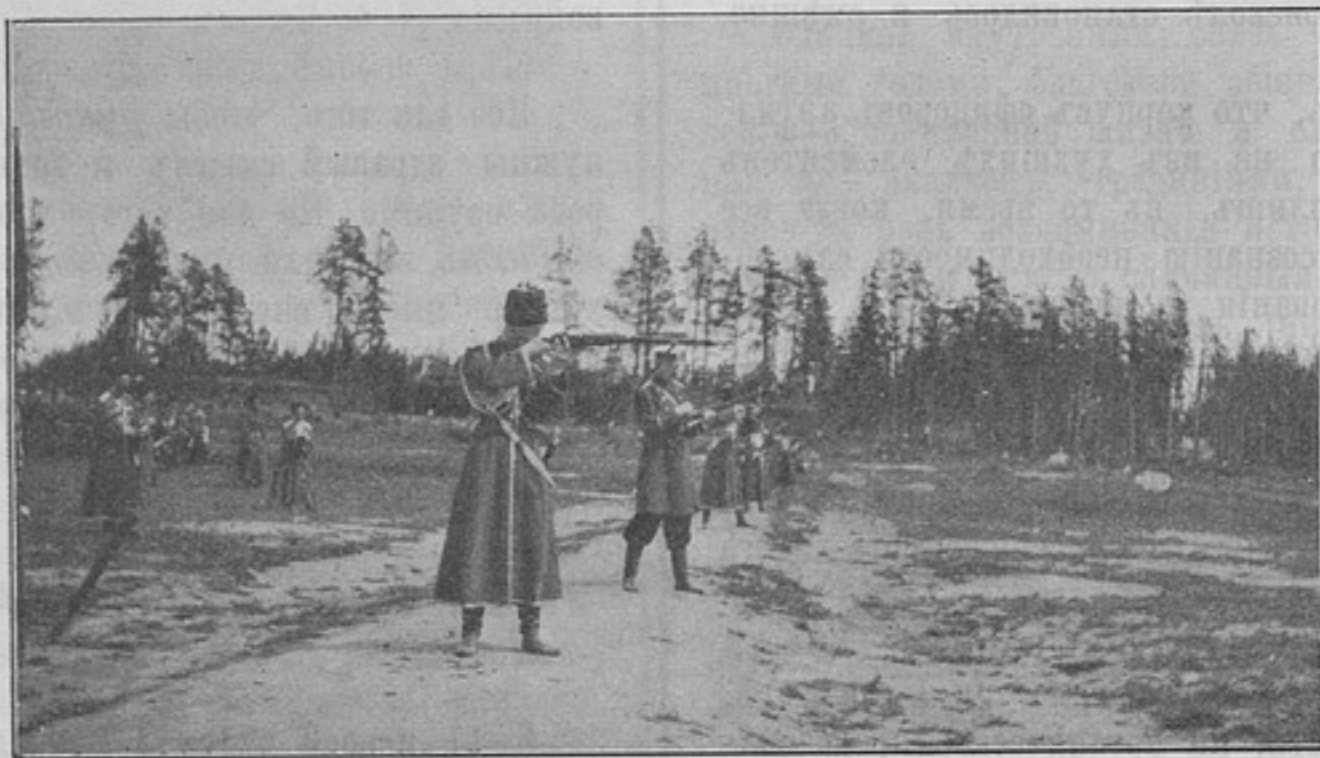
Его Императорское Высочество Государь Наслѣдникъ въ офицерской стрѣлковой школѣ (къ корреспонденціи «Ораніенбаумъ»).