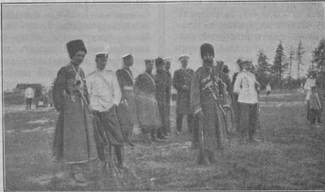
Его Императорское Высочество Государь Наслѣдникъ въ офицерской стрѣлковой школѣ (къ корреспонденціи «Ораніенбаумъ»).