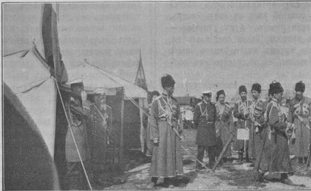
Его Императорское Высочество Государь Наслѣдникъ въ офицерской стрѣлковой школѣ (къ корреспонденціи «Ораніенбаумъ»).

Каждую весну, закончивъ съ грѣхомъ пополамъ «четырехмѣсячное» обученіе молодыхъ солдатъ и поставивъ ихъ въ строй, начинаемъ мы снова хлопоты: собираемся въ лагерь. Начинается укладка, сдаваніе ненужныхъ лѣтомъ вещей въ полковые цейхаузы, приготовленія къ походу въ лагерь, хлопоты, суета и т. д. Наконецъ, перебираемся «на дачу» нашу, какъ иные предполагаютъ, «на свѣжій воздухъ»... Вызывается это переселеніе, какъ говорятъ, необходимою для войскъ «полевыхъ» занятій, подготовки къ дѣйствію «на мѣстности», маневрированія и т. п.