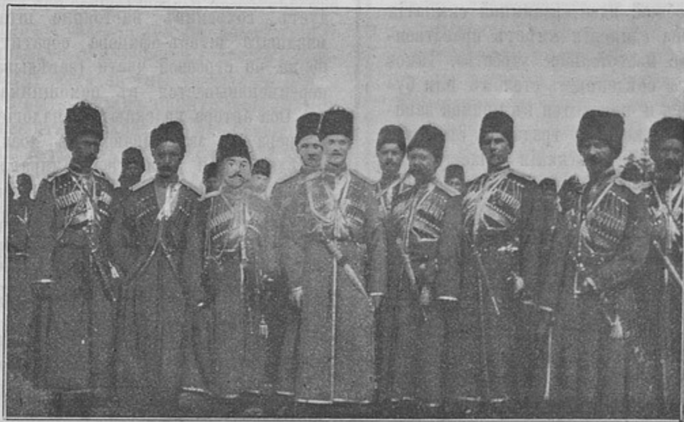
Его Императорское Высочество Государь Наслѣдникъ въ офицерской стрѣлковой школѣ (къ корреспонденціи «Ораніенбаумъ»).