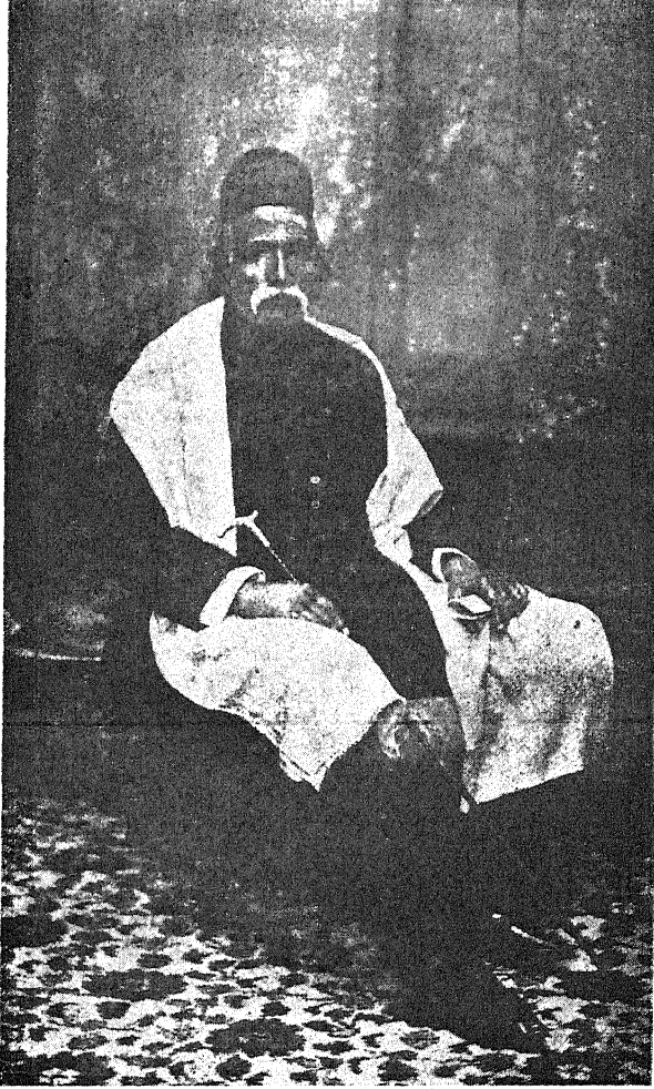
उपाध्याय पण्डित बदरीनारायण चौधरी 'प्रेमघन' (सभापति, तृतीय हिन्दी साहित्य सम्मेलन, कलकत्ता, १९६९)