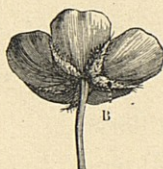
FIG. 2. — Fleur de Renoncule vue par-dessous.