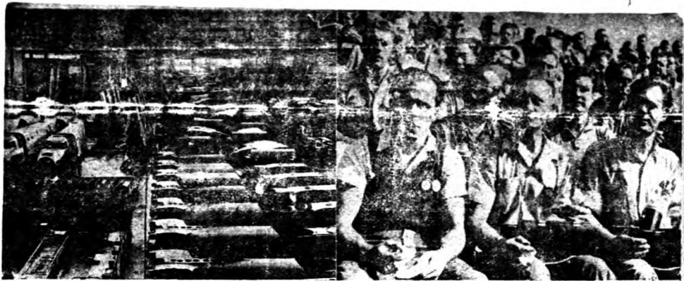
。場工造製機飛之頓停全完於陷心