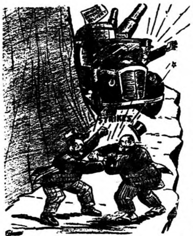
。碍障大一的業工軍擴國美是紛糾資勞心

在各種工業之中，潛伏着共黨份子，以鼓動罷工為能事。有時，除去為了工人的利益而實行罷工以外，共