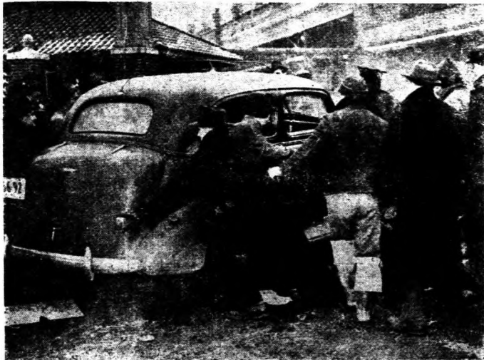
→ 勞工協會糾察員在罷工期間勸阻工人進入工廠。

美國所謂「國防工業」的進行，現在遇到了兩種最大的暗礁。一是勞資兩方工資及其他問題所發生的糾紛，罷工等問題；二是勞力的缺少，工作技術人員不敷應用。由於工人時時以罷工為手段威脅廠方，使廠方不能按照預定之生產計劃而促使工作之繼續進行；由於怠工或罷工之發生，大部分之主要國防工業部門竟而陷於停頓的狀態；由於勞力供給量之缺少以及專門技術人員之不敷分配，同時，從事於國防工業生產之各大工廠尚須按照預定之生產額，而實行到期交貨，所以，造成了工作時間之增加，品質的降低，以及工廠之間發生了爭奪專門技術人員的怪現象。 單就最近所發生之罷工而論，前後約有三十餘部門之工業因而停工。國防工業中最重要之部門，如驅逐艦建造之計劃，機器製造，軍火原料之生產等，均陷於靜止狀態。實行罷工者雖為數有限，但直接受其影響之工人，約有六萬餘名。其次，根據「美國工業聯合會」的調查，在一百種國防基本工業之中，竟有百分之四十五感到技術人員之缺少，因之，在海軍部及陸軍部合力籌劃之下，期於本年度內增加七十五萬名技術人員。其他國防工業因勞力缺少之故，已將每日工作時間增加到十一小時，甚至一部分工人每週內須工作七十小時。由以上事實看來，國防工業之進行可暫時解決失業問題，但是隨此而來的勞資糾紛以及生產品品質之降低，將永遠伴隨着國防工業之進行而繼續無已。