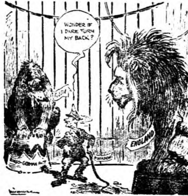
！呢俄防雷還英攻心

目的——赤化世界的意義。其併吞西部國境地帶，不但是簡單的擴張領土，更有着擴張社會主義國的意義。同時也可以看做是向世界革命前進。以波羅的海三國正式加入蘇聯的過程來看，樹立民主主義政府，容許政治的自由，使共產黨合法化，改正選舉法，於新選舉，新議會宣言蘇維埃化，加入蘇維埃聯邦，各自構成入盟共和國，據說要經過這些過程的，也就是由民主主義革命進至社會主義革命。在波蘭，芬蘭，波羅的海三國，以及比薩拉比亞等地，亦