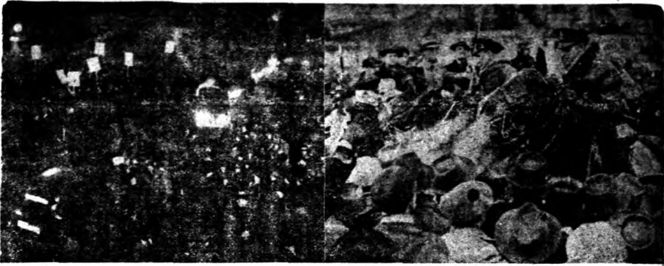
。市街要主各於威示行遊隊列人工工罷間夜