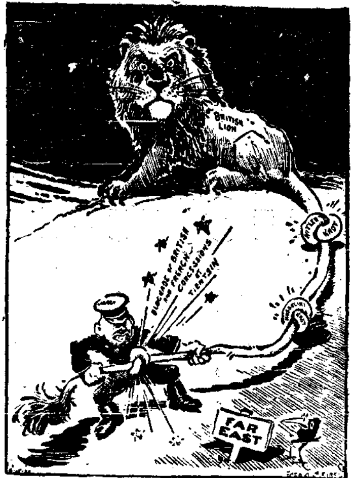
不列顛獅的三個尾巴