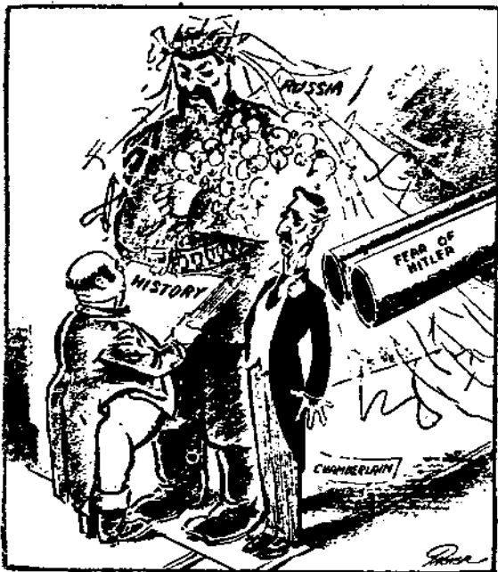
在希特勒的炮口下，結起婚來了！

此次黑市外匯狂瀉的起因，發生於本市各銀行的拒用華北地名的法幣，天津的匯價，常在「上海」之下，投機家在上海購進外匯，到天津去賣出，一轉手間，即可大獲利潤，傳某方就利用此點，捆載華北法幣四千萬，裝運來滬，擬在上海大量買進外匯，到天津去套利，兼遂其搗亂中國金融的陰謀，上海銀行界得到上項消息後，即秉承財政部意旨，實行緊急措置，一致拒用華北地名的法幣，一面壓低匯價，便與天津的匯價相接近，這樣實行後，投機家就無利可圖，陰謀家更無所施其技了！黑市匯價狂瀉的原因，就在於此，而它反映於外的，却是非常複雜的現象，令人眼花撩亂，懷疑及法幣的基礎，其實政府實行此種措施，目的就在維持法幣，政府爲防止資金外流，鞏固戰時金融起見，把黑市匯價提高壓低，可以因時擇地而施，人民實在無庸懷疑，中央銀行掛牌的法定匯價，至今仍維持英匯一先令二辨士，美匯三十美元的價格。