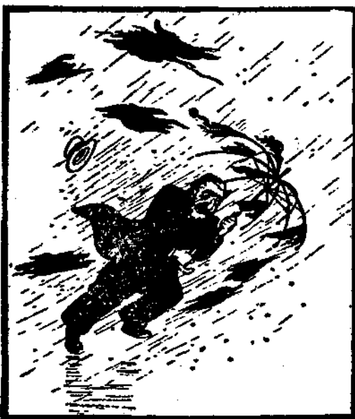
揮着破傘，來緩步遠東了