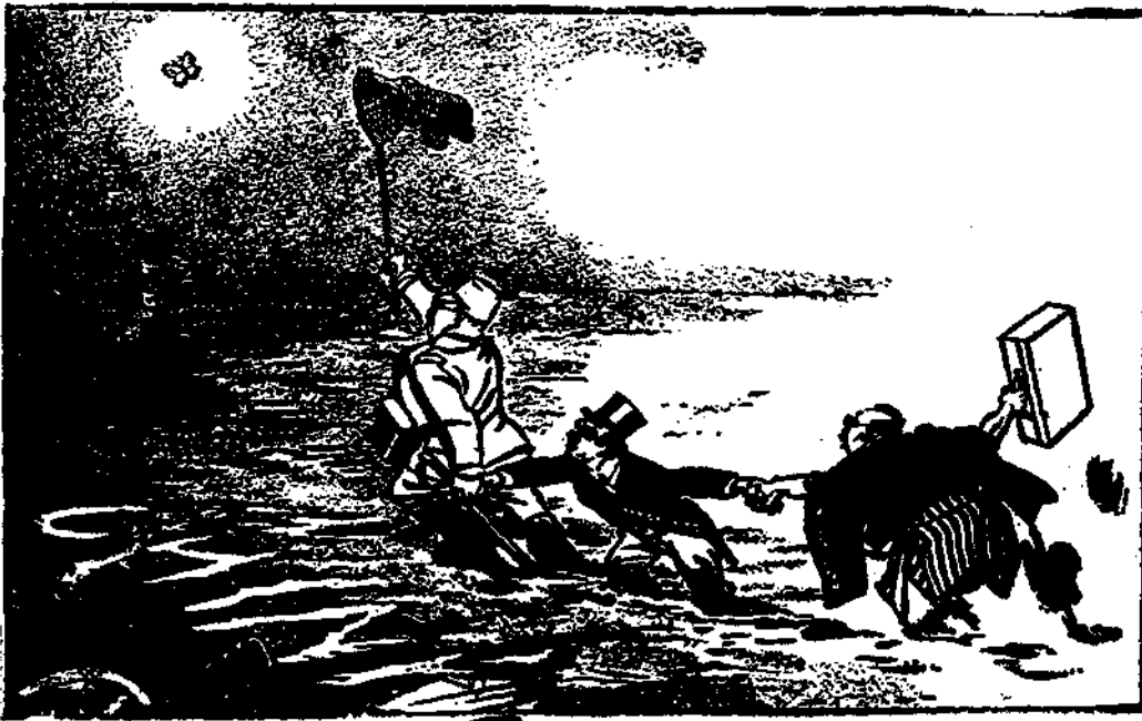
軍團拖着官僚，官僚拖着人民，去捕捉那可惡而不可救的蟻火。

將軍英勇卓絕的指揮之下，在軍事、政治、經濟各方面均呈飛躍之勢。不特在軍事上擊退了敵人，罕罕地扼住了這總反攻的唯一基點，而且在政治、軍事兩方面，雙管齊下，深入敵後，威脅侵略者的心臟。使日人「以戰養戰」、「經濟榨取」的詭謀，全趨破滅。這可以說是我們戰略上一個最偉大的勝利。最近顧長官曾就東戰場的有利