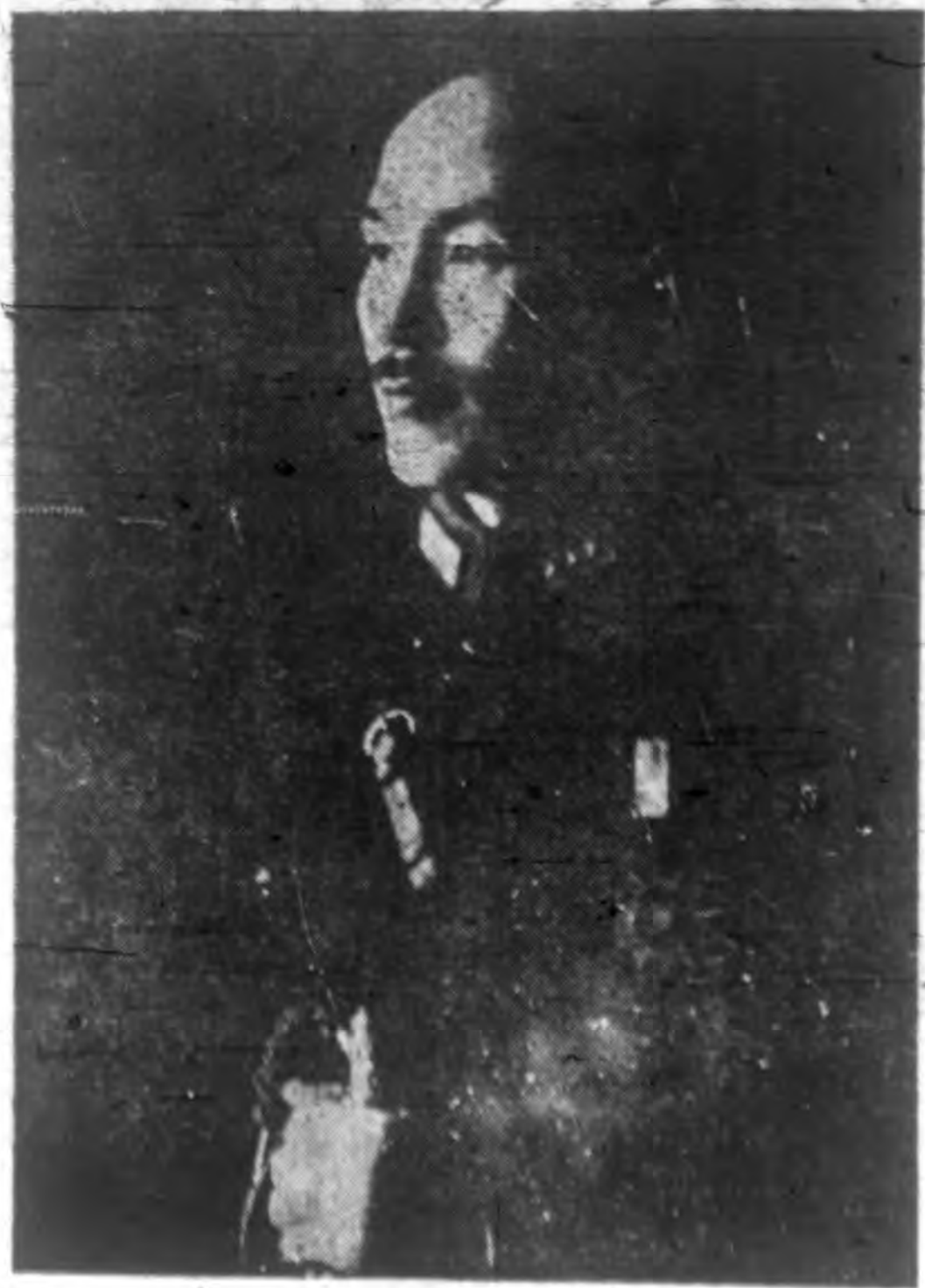
· 本 社 名 譽 總 社 長 蔣 主 席 近 影 ·