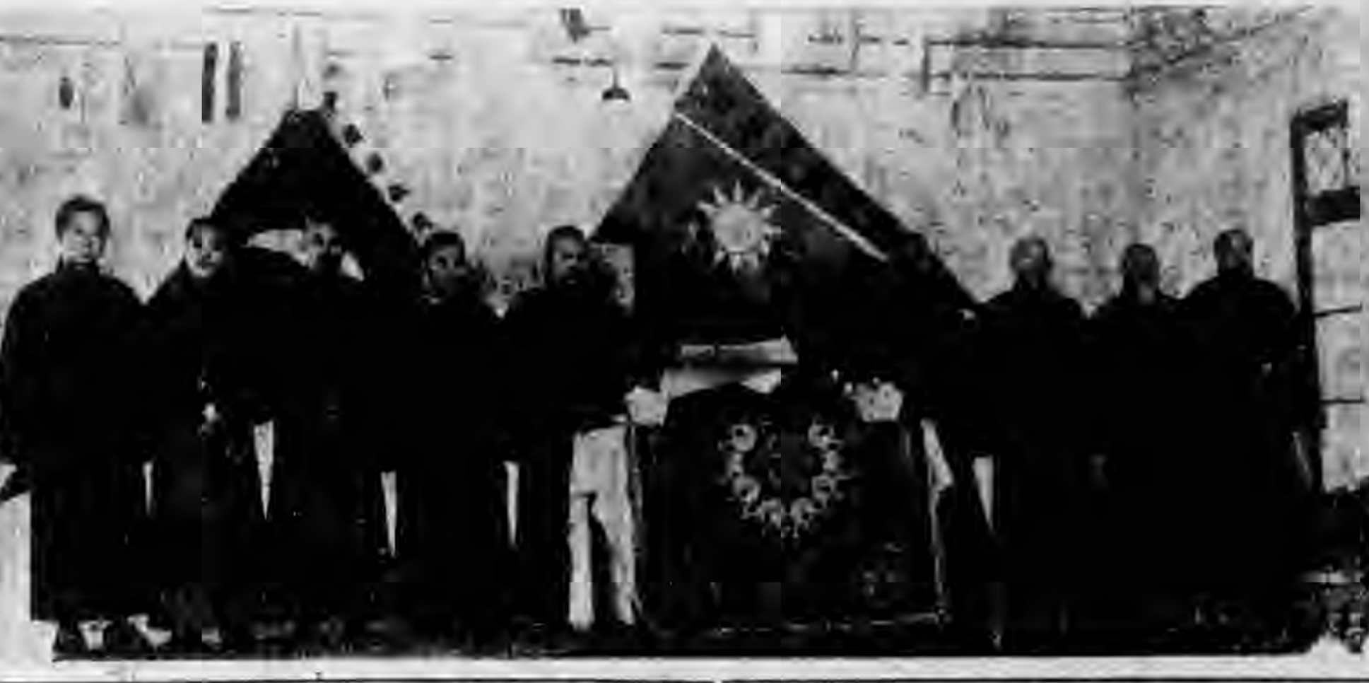
回教總聯合會全體委員合影