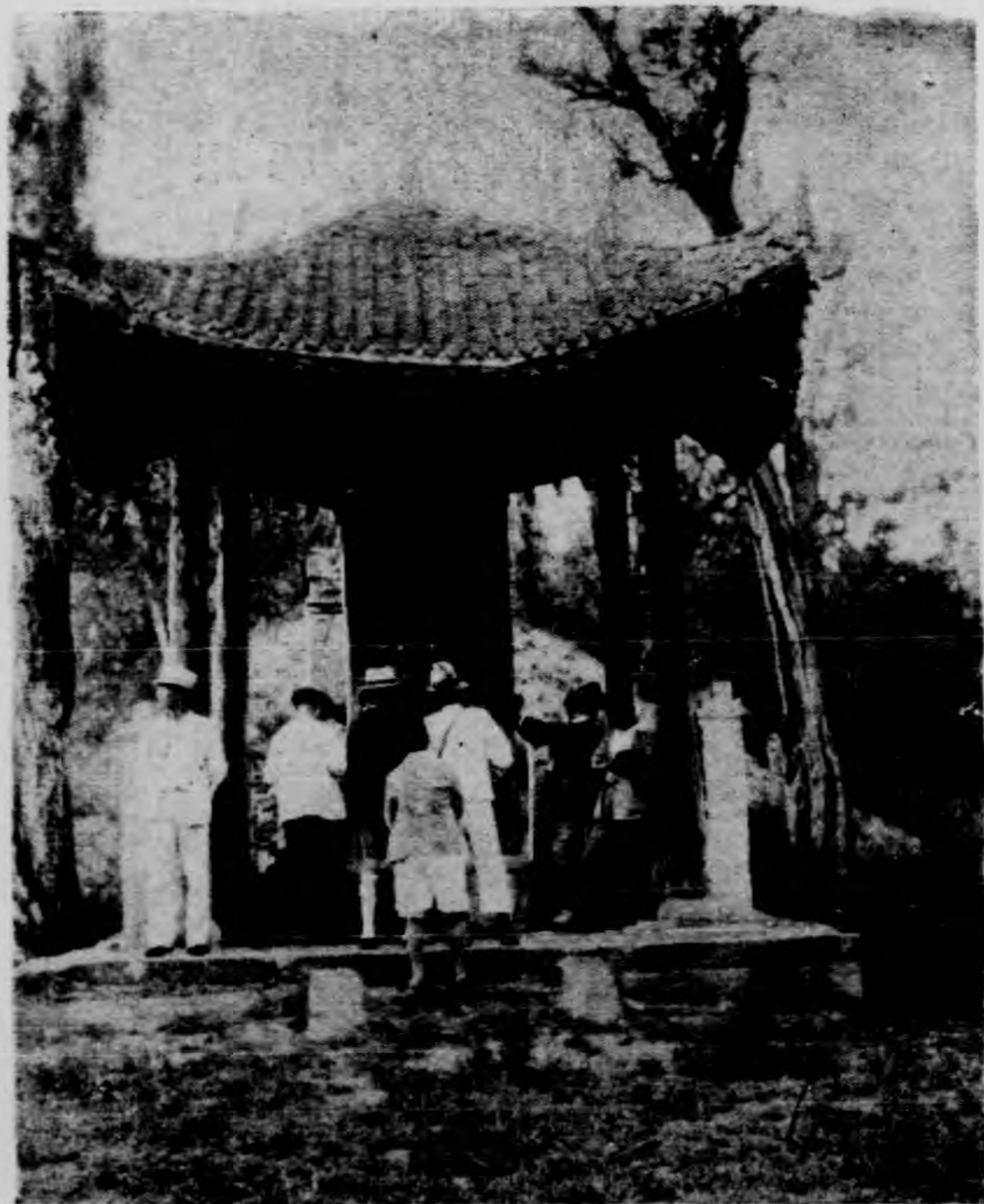
黃 帝 墓 前 之 碑 亭