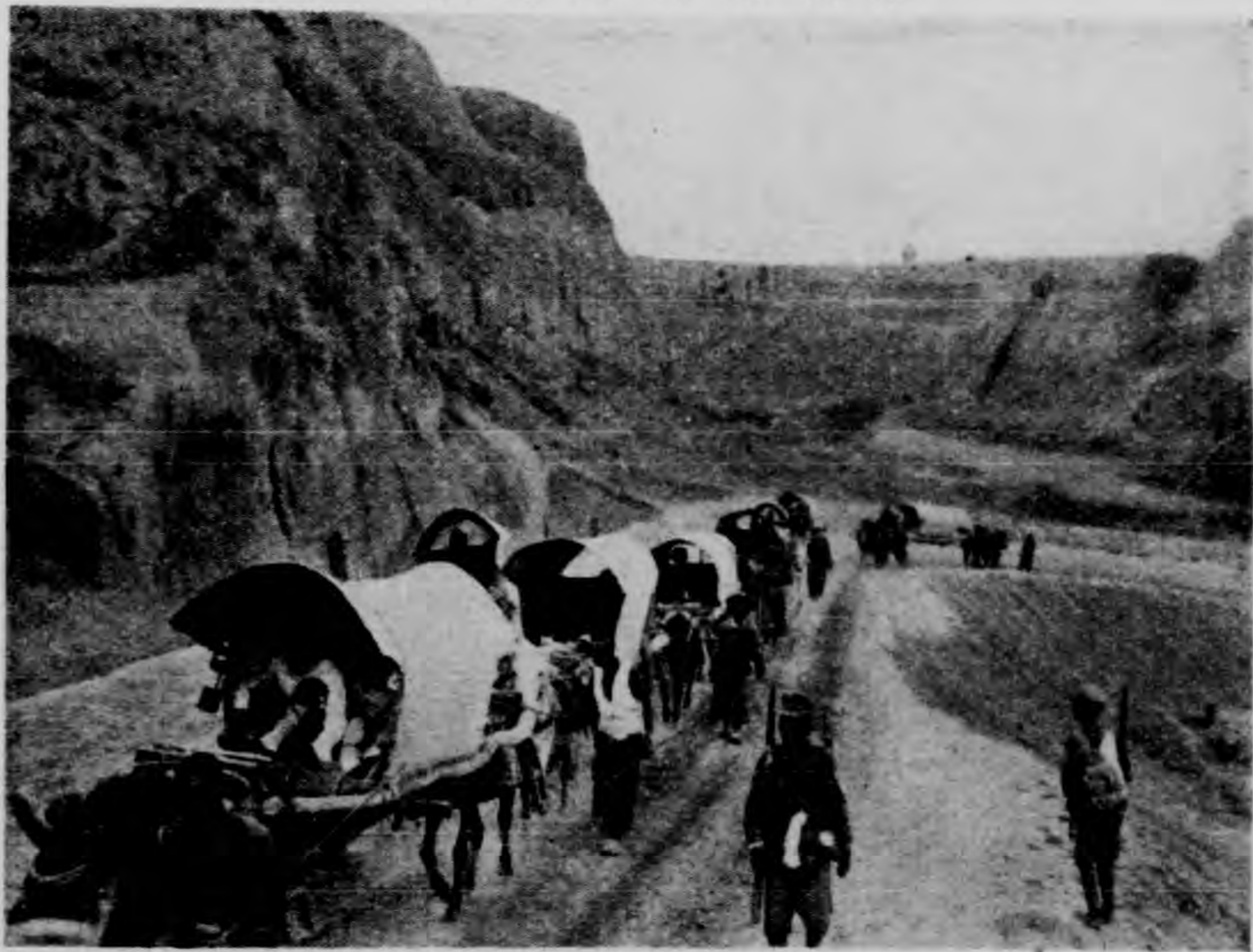
發出原三從帶如蜒蜿隊窩夾