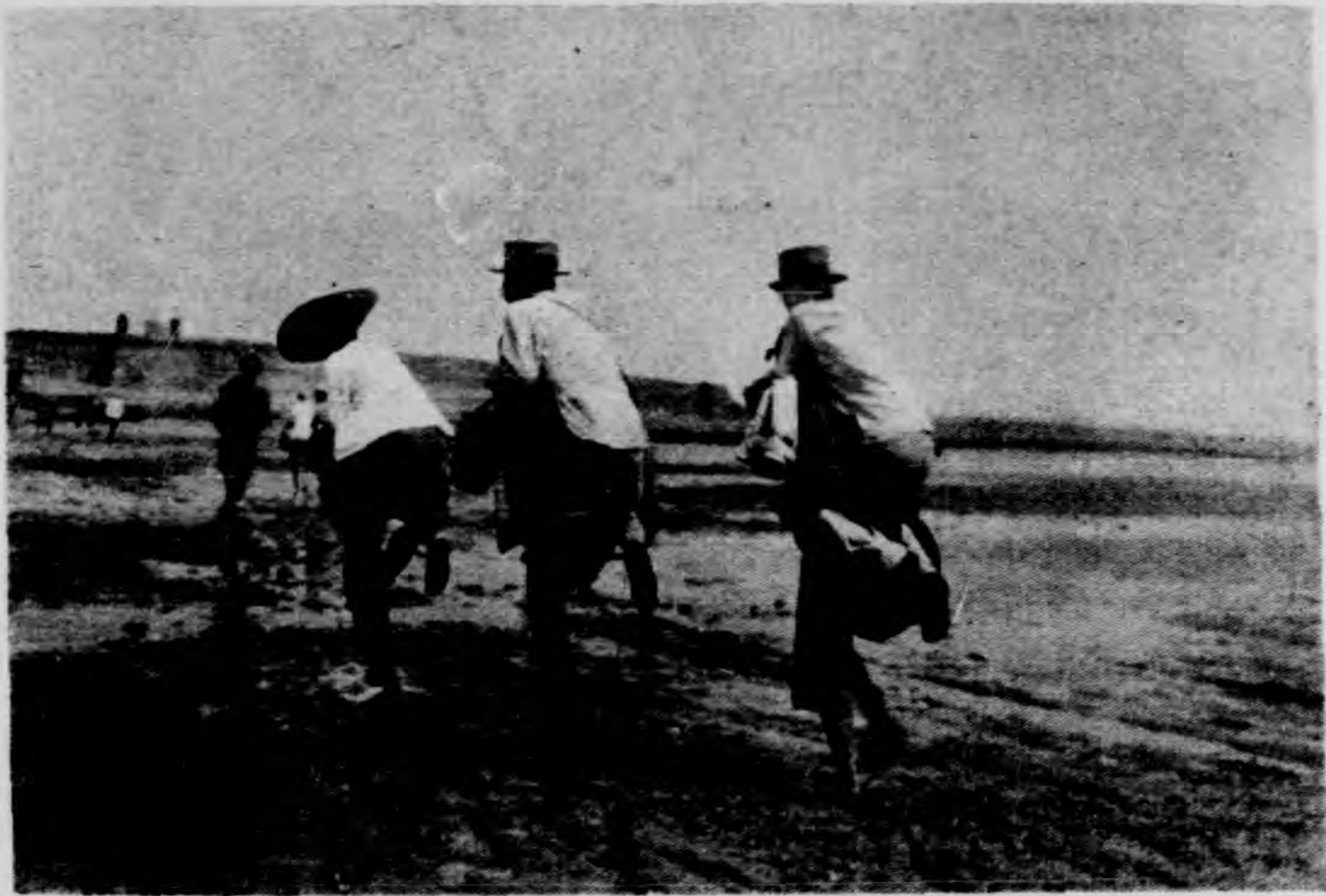
咸 陽 古 渡