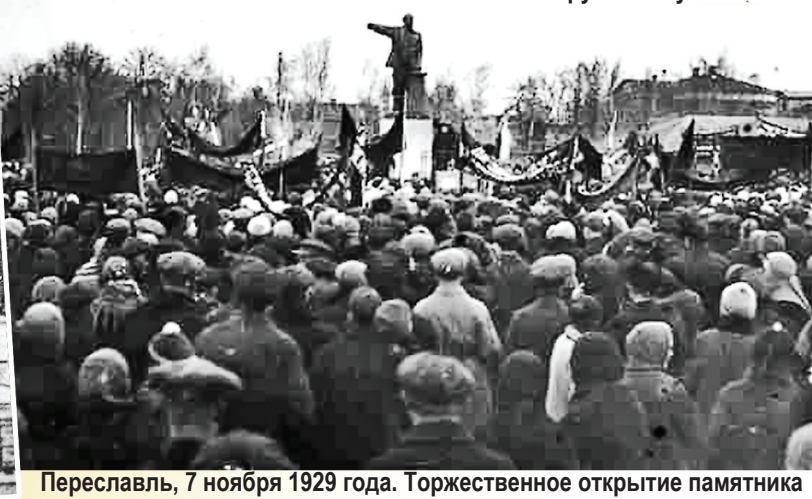
Переславль, 7 ноября 1929 года. Торжественное открытие памятника