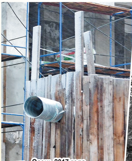
Осень 2017 года. Ленин в деревянном «пальто», рука в рукаве из металлической гофры