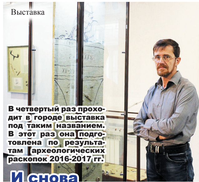
Выставка В четвертый раз проходит в городе выставка под таким названием. В этот раз она подготовлена по результатам археологических раскопок 2016-2017 гг.