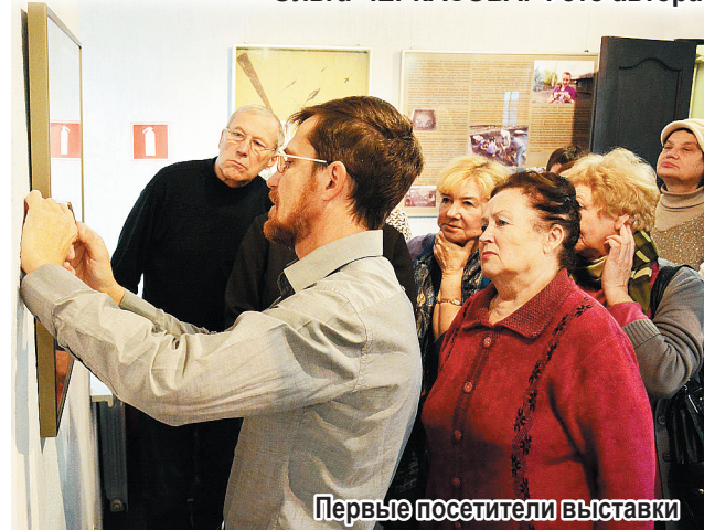
Первые посетители выставки