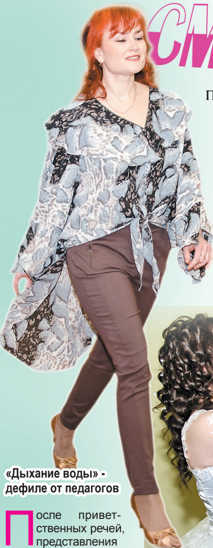
«Дыхание воды» - дефиле от педагогов