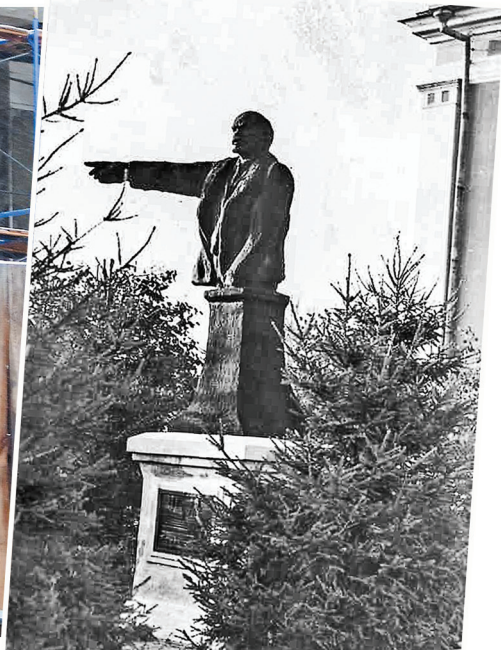
В начале 70-х Ильич стоял у Дома культуры химзавода в окружении густых елей