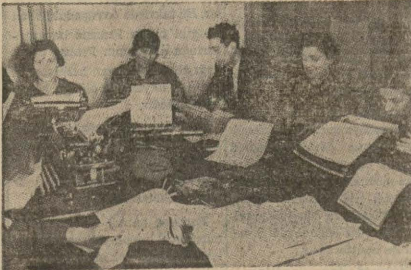
Yeni mebus intihabı hazırlığına şehrimizde devam edilmektedir. Kazalardaki daktilolar intihab hak kına malik olan ve olmıyanlara ait nüfus cetvellerini hazırlamaktadırlar. Resimde Beyoğlu mntakasında cetvellerin tanzim işi görülmektedir.