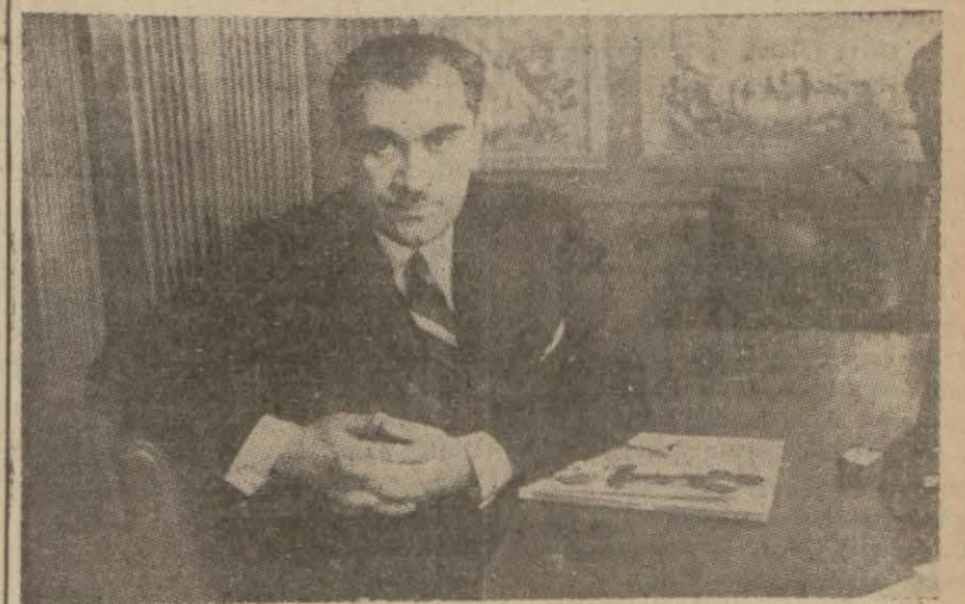
Maarif Vekilimiz B. Hasan Âli Yücel