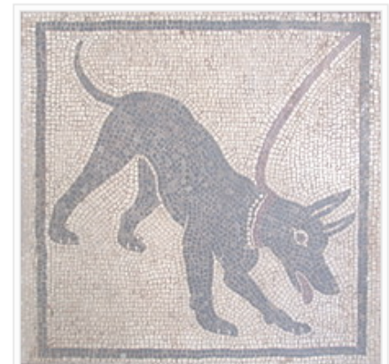
Mosaic romà mostrant un gos amb collar