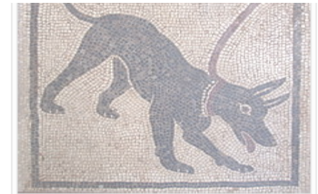
Mosaic romà mostrant un gos amb collar

L'enorme varietat de mides dels gossos. Amb una alçada alguns exemplars de gran danès superen aquesta mida, arribant fins a 107 cm). [23] La raça més petita de gos és el chihuahua , amb una mida de 15-25 cm a la creu . Amb un pes mitjà d'entre 1,5 i 3 quilograms (i que en alguns casos pot no superar els 500 g) [24] els chihuahuas també són els gossos més lleugers; els