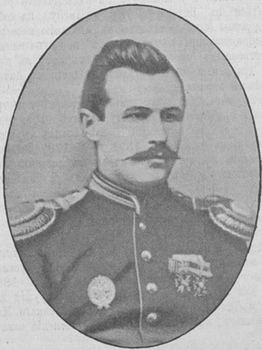
Въ 1874 году