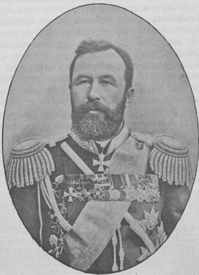
Въ 1899 году

Генералъ-отъ-инфантеріи Алексѣй Николаевичъ КУРОПАТКИНЪ.