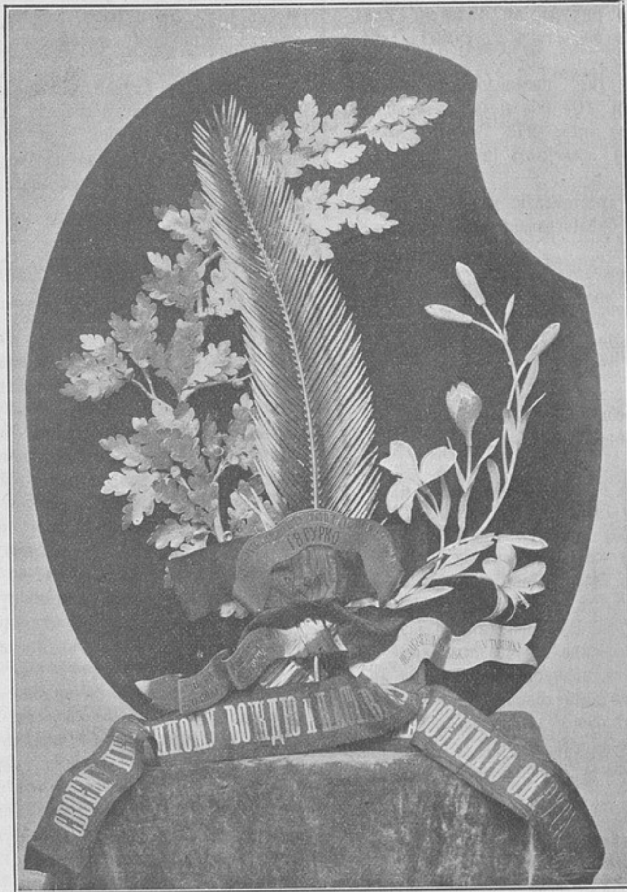
Войска Варшавскаго военнаго округа своему незабвенному вождю и наставнику.

Такъ, напримѣръ: въ одномъ изъ приказовъ по округу сказано, что въ какой-то части въ теченіе нѣсколькихъ мѣсяцевъ лошадямъ овса вовсе не давали, а кормили ихъ однимъ только сѣномъ и то «въ меньшемъ противъ положеннаго количества» (казенная дача сѣна 10 ф.). Говорилось, что часть пришла въ полное разстройство, а конскій составъ, по крайней мѣрѣ временно—въ негодность... далѣе послѣдовало то, что мы описывали выше, т. е. приказы, комиссія, обѣдъ и т. д. Одинъ примѣръ изъ многихъ, но кажется, что и этого достаточно, не говоря уже о томъ, что не мало ускользаетъ