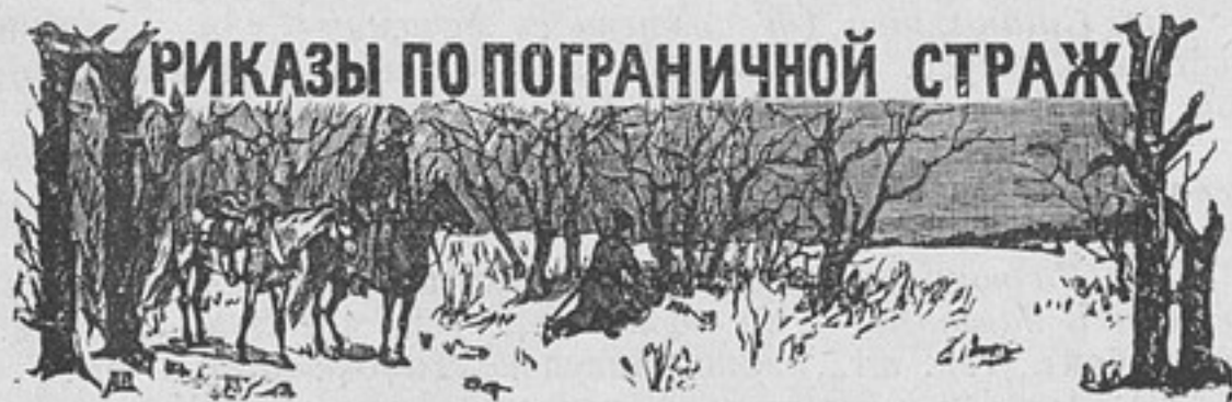
Января 19-го дня, въ С.-Петербурѣ.