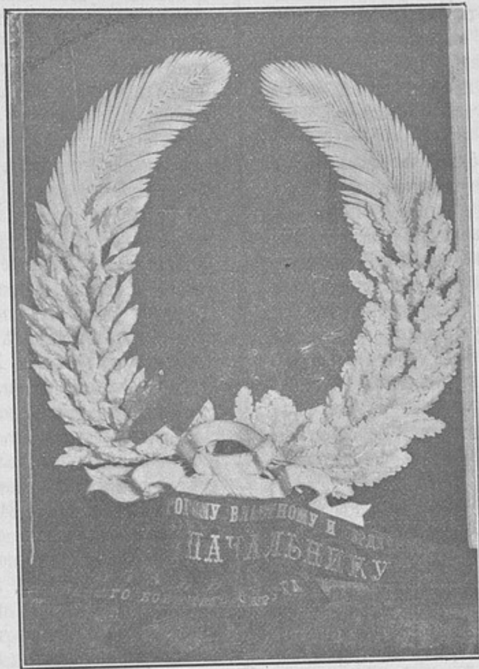
Дорогому, властному и сердечному начальнику — штабъ Варшавскаго военнаго округа.

Но главнымъ образомъ слѣдуетъ кореннымъ образомъ