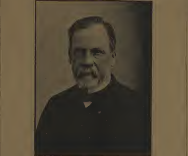
Louis PASTEUR le père de la médecine moderne, gériseur de la rage créateur de la Bactériologie. 1822-1895.

Joseph LISTER Illustre chirurgien anglais, le père de la chirurgie moderne inventeur de l'antisepsie chirurgicale