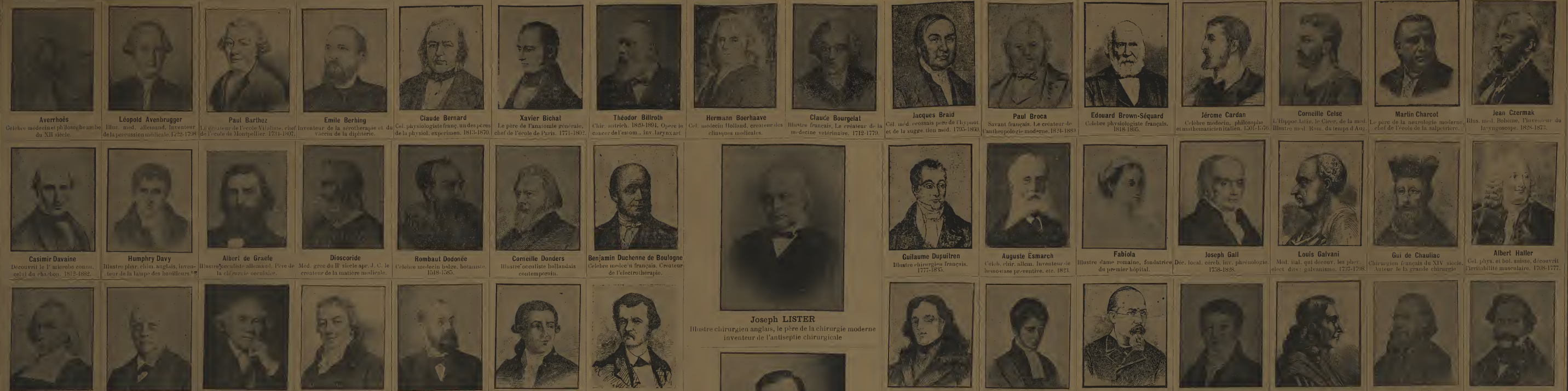
Row of names and brief biographical notes for the figures in the grid above, including names like Casimir Davaine, Humphry Davy, Alinari de Graefe, etc.

Joseph LISTER Illustre chirurgien anglais, le père de la chirurgie moderne inventeur de l'antisepsie chirurgicale