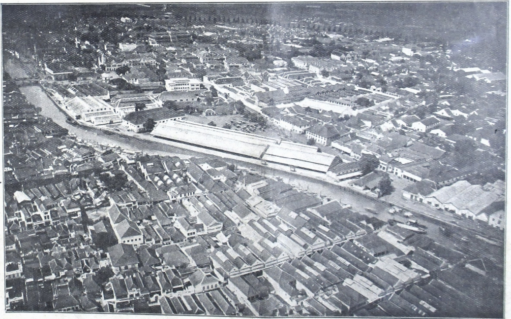
ပြည်ထောင်စုအဖွဲ့အစည်းများနှင့် အခြားအရေးကြီးသော အကြောင်းအရာများ