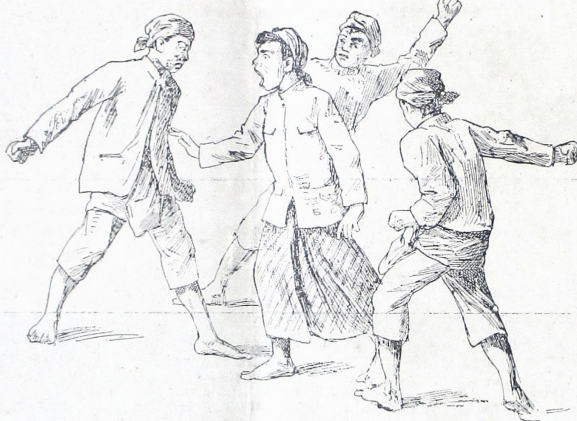
ပုဂ္ဂိုလ်တို့၏အကျိုးအမြတ်

အကျိုးအမြတ်ကို ရရှိရန်အတွက် အားထုတ်ကြသည်။