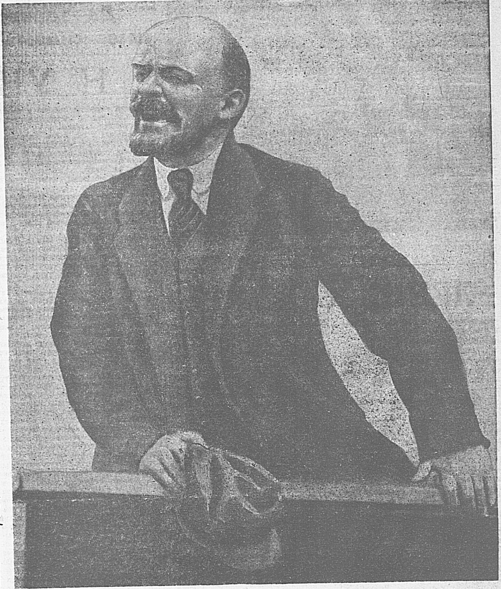
В. И. ЛЕНИН выступает на площади Свердлова в Москве перед красноармейцами, отправляющимися на фронт, 1920 год.

Под знаменем Ленина, под руководством Сталина — вперед к победе!