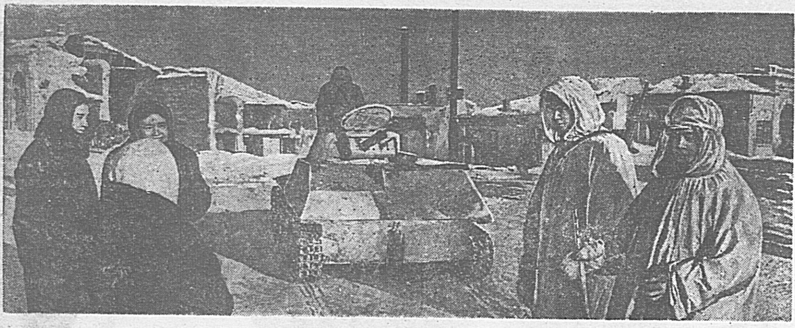
Первый день в освобожденном от немецких оккупантов городе Можайске.