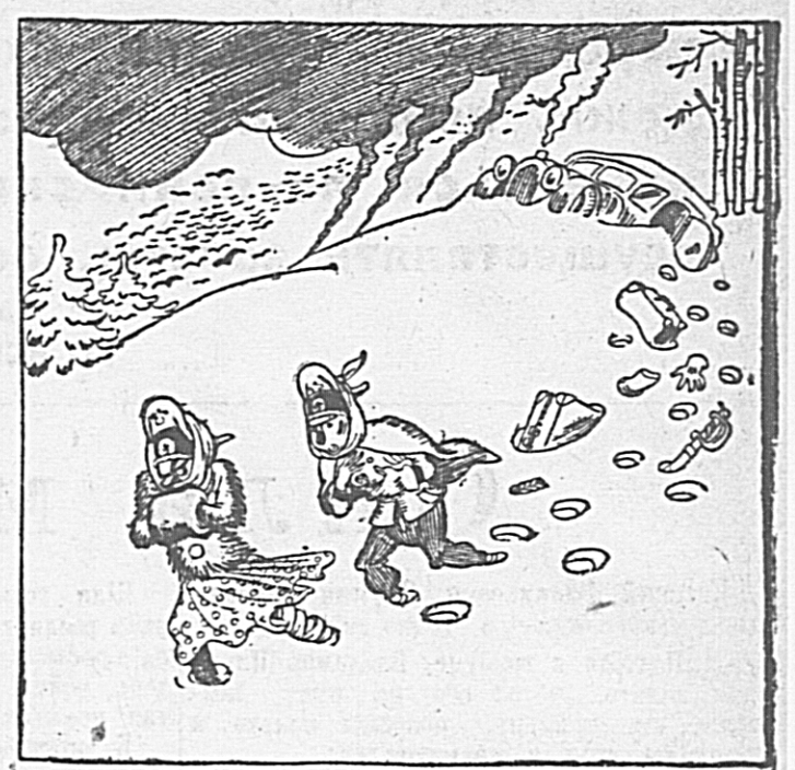
— Ведь мы отступим по заранее обдуманному плану? — Да, но беда в том, что этот план обдумали не мы, а советские генералы. — Р. И. ЛИСА.

СТОКГОЛЬМ, 19 января. (ТАСС). Скандинавское телеграфное бюро передает: Судя по сообщениям германских военных корреспондентов, советские партизаны наносят немцам большой урон. Против них пришлось мобилизовать все силы. Созданы специальные германские части для борьбы с партизанами. Германские солдаты с большим трудом борются против партизан, действующих в основном ночью. Партизаны вооружены тяжелыми и легкими пулеметами, автоматами, гранатами, винтовками с глушителями и т. д. Они располагают базами в лесах и глухих местах.