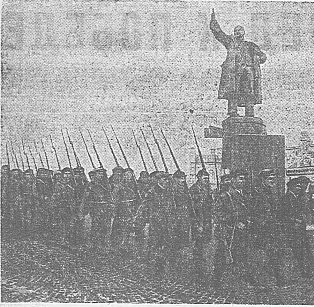
У Финляндского вокзала.