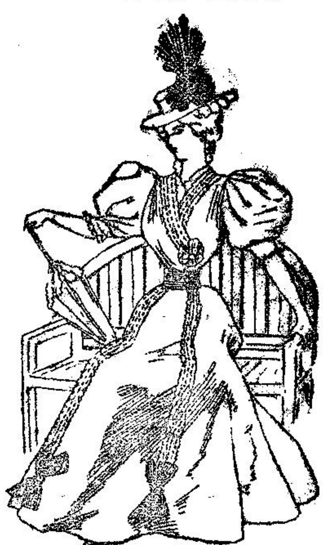
Traje de paseo para señorita

Es de gasé marbré ; va el cuerpo ajustado al talle y escotado; lleva cruzado el delantero y un adorno en el borde, compuesto de muselina arrugada, el cual finaliza con un chús en el lado izquierdo; un volante de muselina plegada y mangas cortas, al final de las cuales se coloca una tira de muselina fruncida igual al delantero, completan este cuerpo. La falda es en forma de campana, con dos tiras de muselina arrugada, y en el borde de esta dos lazcos de cinta de raso. También es de raso el cinturón.