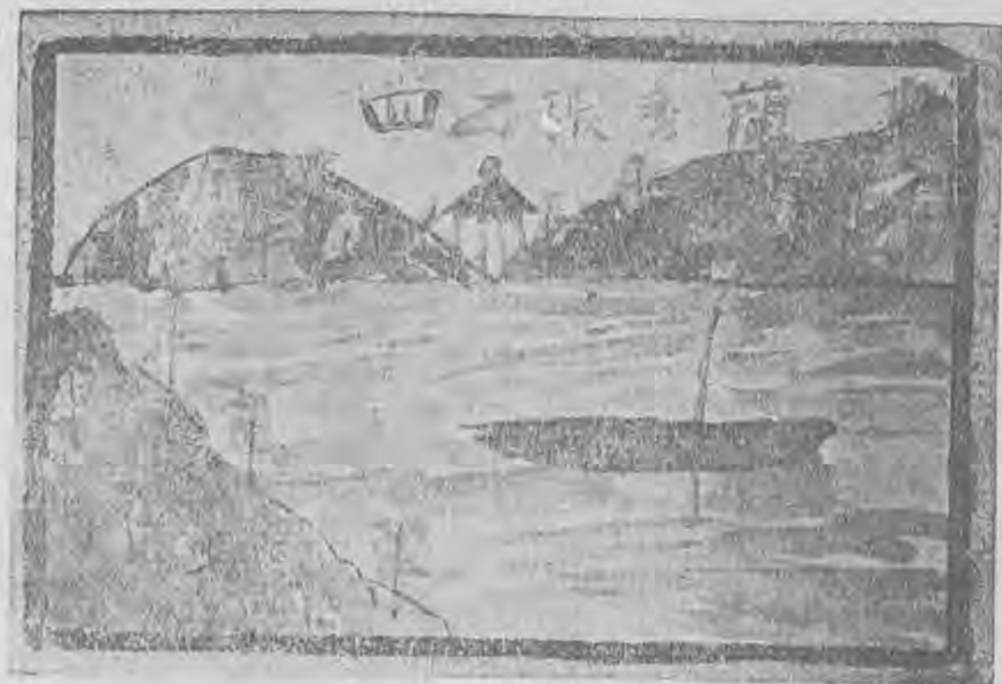
孤 舟 張 秀 蘭