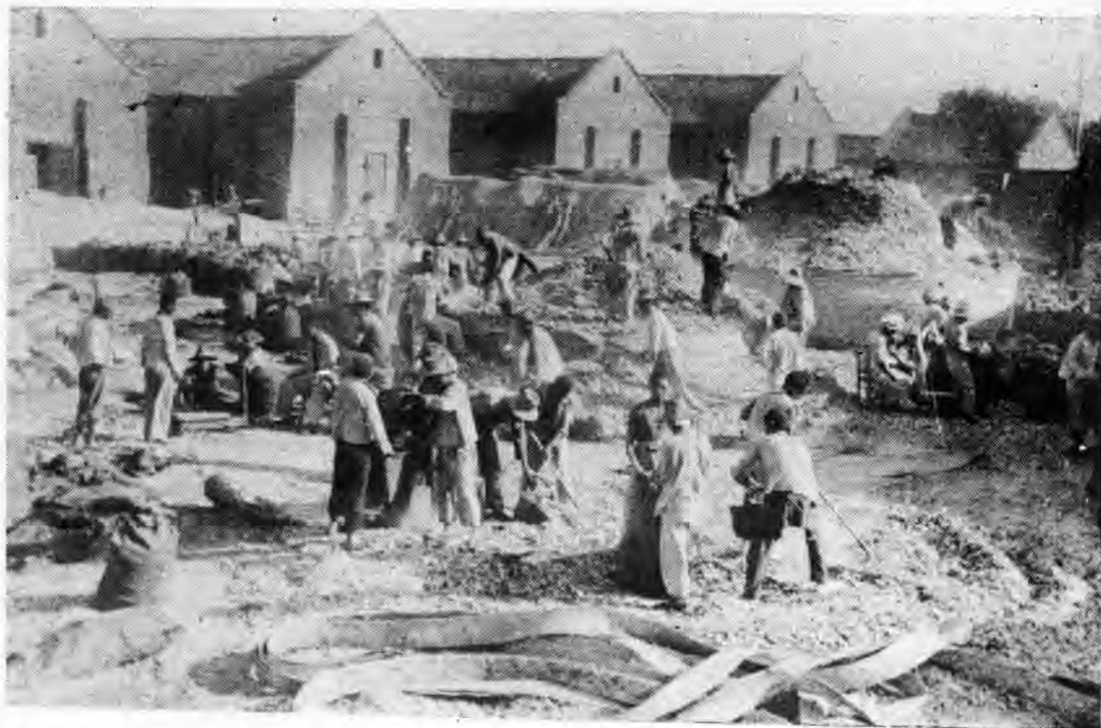
秤過始開（下）袋裝紛紛（上） 形情薯白乾買收聯縣邱商