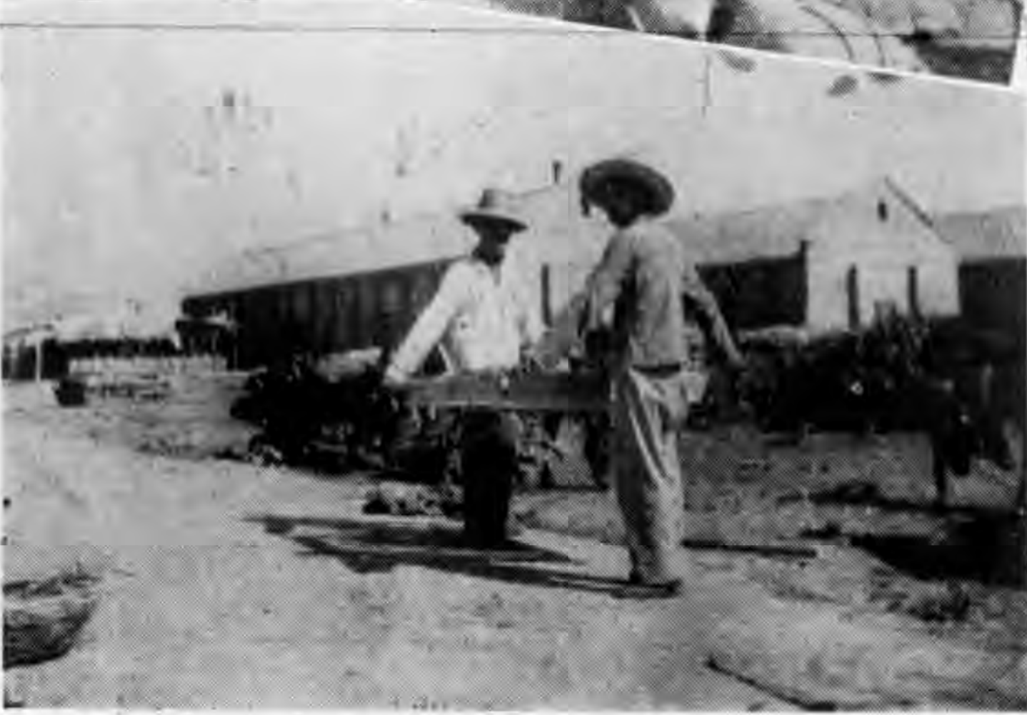
景 全 聯 縣 ( 上 )