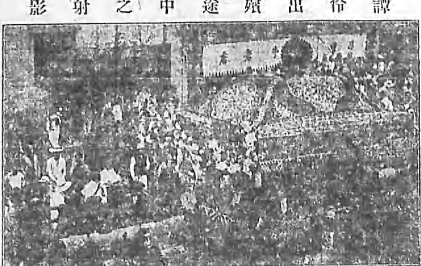
伶出殯途中之影射