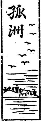
孤洲 期四二第 稿投迎歡