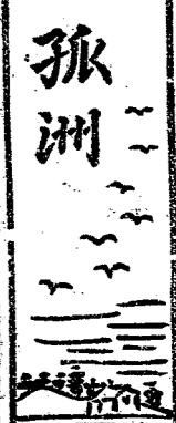
孤洲 一期四二第 稿投迎歡