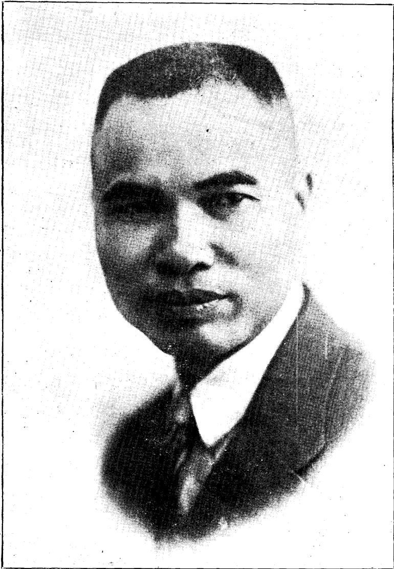
林 廳 長 翼 中 照 像