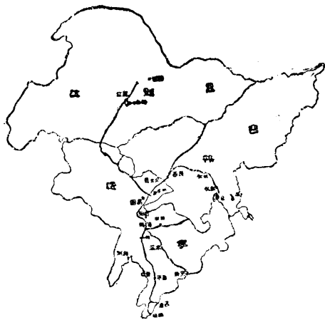
( 圖 全 省 三 東 )

還以為是日軍操 演，事後才知道 是日軍炸斷南滿 鐵路柳河橋的聲 音。原來日本軍 隊自己炸壞橋樑 ，就反誣我們， 說是中國軍隊的 動作，並且就把 炸橋作為發動信