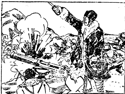
馬占山將軍率軍隊在嫩江橋抗戰殲滅