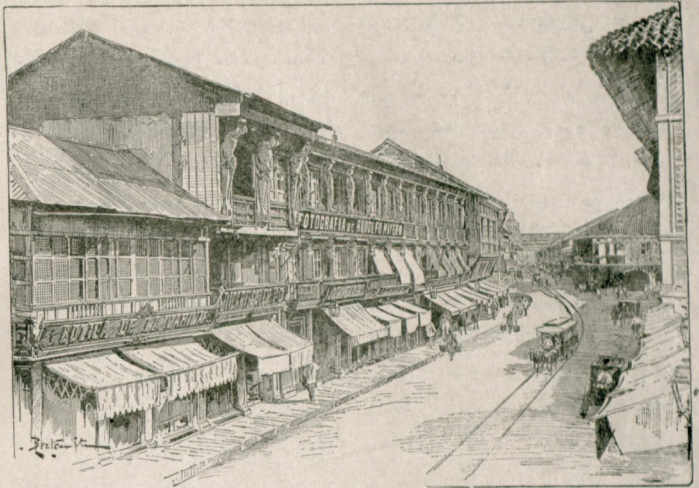
[ فیلیپ آلمرندده واقع مانیل قصبه سنده برسوقاق ]

فکر تحلیل ومؤاخذه نك توسی انسان ایچون الك طاتی خویالردن معدود اولان عشقده دوجار زلزله ایدرک قبلرده بونک ایچون برعدم اقتدار حاصل ایدر . بر طرفدن آمال شایمز سودیکمز قادی منحصرأ