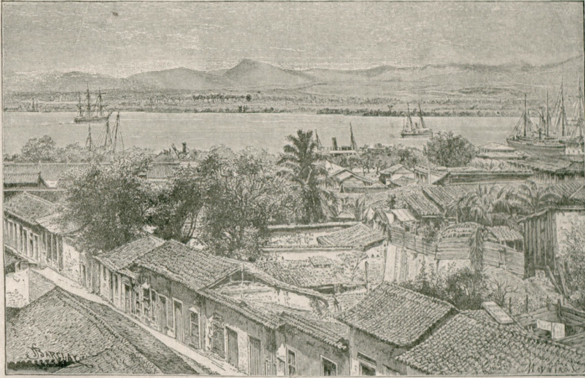
[ اسپانيا دوخمانسك واصل اولديني سانيانو قصبهسى ]

بوؤالارك بويله الى غير الهايه تسلسل وتعدد ايدمه چكى قولاي اكلانشلير، بو اصول ايله بر محررك اثريني تدقيق ايجون بر قاج سنه اوغراشمق لازم كايير . بوكا مقابل تنقيدك الدندن ده برشي قورتولماز، اولور، نقطه نظر بو بودكجه بو بور . افقار كسب وسعت ايدر . بويله جه . مثلا بو بوك بر محرري ، بروولته ري تدقيق ايتك تون معلومات بشره اطرافده دور ايلمك ديمكدر .