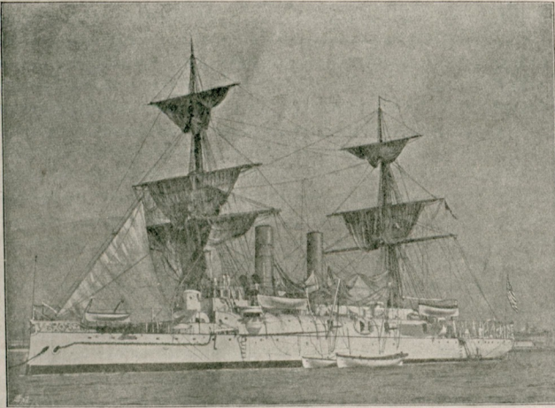
( ماییل پیشکاهنده اسپانیا دوئمانسی محوایدن سفائندن بوتون نام آمریکا قروواوزوری )

خروشانی که تلاطم غایبانیسی آرمسند هر کس کندی حسابی آرقسندن غلطان اولیور. اصول اداره عوام بکنظرده اصحاب اهلیت ایچون بک مساعد بر محیط کبی کورونور؛ چونکه هر دورلو مساعی به هر قابنی کشاده کوسته بر. فقط بویه اولمغه اوشداید قانون رقابتی درجه افراطه ایصال ایدر. عالی بر تدریس ایسه افکار عوامک شکل طبیعیسی اولان شدتلی بر حواش طرفکیرانه به سالیک اوله به حق قدر ایچیه دوشونوخی ذوات پشده بر دیکندن بونلک استعدادی انکشاف ایدم. بوجریان احواله اوزاقدن نکران اولان ذوات مقتسدرمک، اقتسدار متوسط اصحابی نائل مظفریات اولیور کورمهری کندیلرنده بر افعال حصوله کتیر. بوندن بر تجرد، بر انزال چیقار. صنعتکارلر بویالکزلقلری حس ایدمهرک اثرلریک فی الحال حاصل ایدم چکی تأییردن آرتق اندیشه اتمزلر. ایچیه لشمش فکرلریک، رقوق جهلریک عقلسز، قبا، عنیف تالیق ایشدکاری خلق اوزرنده نه تأییر حاصل ایدم چکی دوشونمزلی بیله. بحرلرک غایبسی، اعصار مستقبلهک آرای عمومیسی اوکنده دائمی بر نامزد صفتی محافظه ایچینی دوشونمکیدر؟ بقینده بر زمان کلهجک که انسالرک خاطرهری