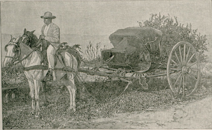
[ کوبا عربی لری ]

بروکت و برسین که سامان افندی مأموری حسیله دائماً بورالردن کیدوب کلدیکی ایچون بزه رهبرلک ایتدی . کذراکاهز سورلمش ، یموشاق طوبراقلی اراضی ایله محدود اولدیغندن بولک خارحسه تحطی ممکن دکلدی . بو جهتله هپ بر خط اوزرندن کیدبوردرق . یاغور کسلمدیکن صیاحی ایدنجیه قدر چکمدیکمز صیقتی قلندی . هوا کوندوزینده اولخالده دوام ایتدیکی ایچون هیچ بر برده توقف ایتیرهک و برلقمه یه جک بککه فرصتای اوله میره ق حیوانلر - منک اولانجه سرعتیله سوروب کیتدک . بنغازی یه مواصلتمزده ساعت یدی بچق ایدی . دیمک که اون بر بچق ساعت متاداً حیوان سورمشدک . ندرجهده ایصالندیغیزی تعریفه حاجت بو قدر ؛ اولسه بیله قابل دکلدر . مواصلتمز عقبنده قافله منک محتاج و منتظر اولدیغی حیوانلری کوندردک . مع مافی قافله ایچق ایکی کون سکره بنغازی یه کله ییلدی . بزم مفارقتمزدن سکره آرقدل - شلمنز کوندوزین بوله دوام اتمک ایسته مشلر ایسه ده دوه لک چوغنی قایوب دوشه رک حتی اوجنک باجانی قیرلدیغی جهتله ارتق بوله دوامدن صرف نظره مرتفعجه بر محله چادر قوروب حیوانلر یتنجه قدر بکلمکه مجبور اولمشدردر . ۱۳۰۲ سنمنده جغوبدن بنغازی یه مواصلتم غایت یاغورلو بر کونه تصادف اتمش و بنغازی ایکی سنهدنبری ایلمک دفعه اوکون یاغور کورمش اولدیغندن بتون اهالی عودت عاجزانه می اغورلو عد ایتمشدردی . محکمه تالی بو دفعهده اوله اولمش و روح الحیة زراعت و فلاحت اولان باران رحمت بو کوندن اعتباراً بده ایلمش اولغله خوش آمدی یه کلنلر هپ اوزمانکی وقوع حالی تذکیر ایدیورلر و معرض تبریکده