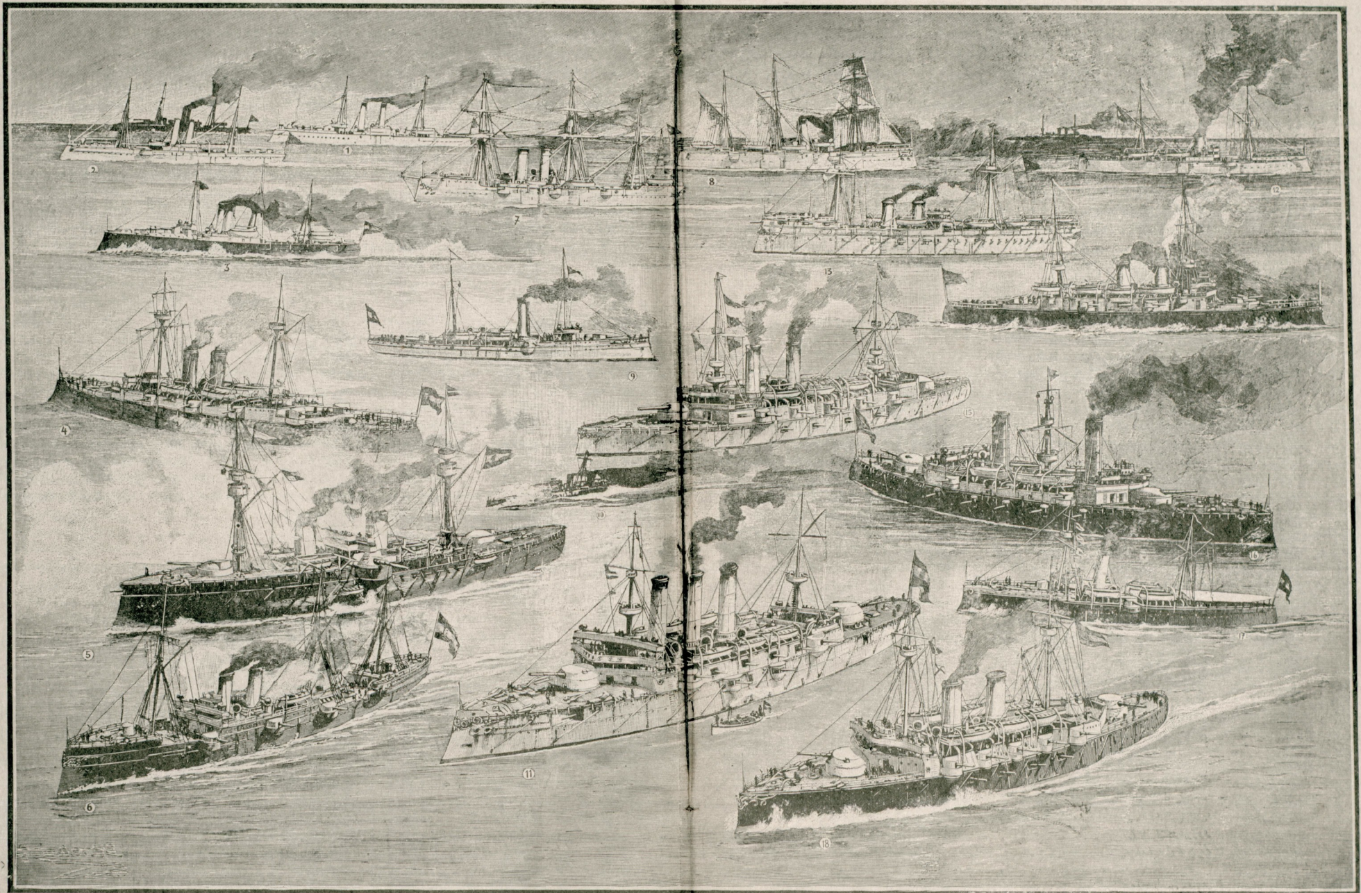
( اسپانیا قوای بحریه سندن بر قسم ؛ جمعا اون سکز پارچه اولوب یدسی زرهلی متبایسی قرووا زوردر )