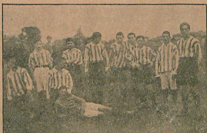
Футбольная команда „Лучъ“ (Сормово), занявшая второе мѣсто на первенствѣ Н.-Новгорода.