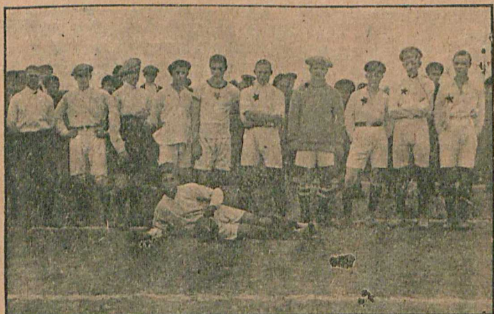
Футбольная команда „Канавино“, выигравшая первенство Н.-Новгорода.